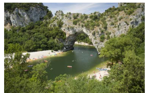
Felsenbrücke Pont d'Arc in der Ardèche

Ein Juwel – diese mittelalterliche Stadt müssen Sie gesehen haben. Hier gibt es die kleinste Kathedrale Frankreichs, und anders als in den touristisch entwickelten Perlen am linken Rhôneufer, scheint Viviers noch wie im Dornröschenschlaf versunken. Ein optionaler Ausflug könnte Sie entlang der Ardèche führen. Im Laufe der Jahrtausende hat sich der Fluss bis zu 300 Meter tief in den Kalksandstein gefräst und damit eine der schönsten Landschaften Frankreichs geformt.