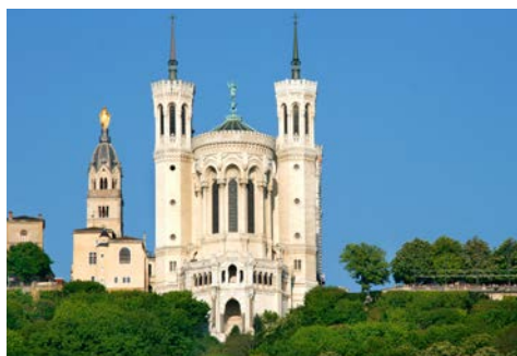
Basilika von Lyon

Start- und Zielhafen ist das wunderschöne Lyon. Beide Reisevarianten ermöglichen Ihnen im weiteren Verlauf die ausführliche Entdeckung der „Stadt der Seide“ mit ihren vielen Gesichtern. Lyon muss man einfach gesehen haben, denn mit ihrer Altstadt, die zum Weltkulturerbe gehört, ihren engen Gassen, Hinterhöfen, belebten Kais und großen Plätzen auf der Halbinsel und den mehr als 200 nachts erleuchteten Sehenswürdigkeiten bietet die Stadt Lyon Gelegenheit zu einer ungewöhnlichen Reise durch Epochen und Kulturen. Zudem ist sie auch die französische Hauptstadt der Kulinarik, geprägt durch Paul Bocuse, den legendären und 2018 verstorbenen Wegbereiter der Nouvelle Cuisine und Namensgeber der berühmten Paul Bocuse Markthalle.