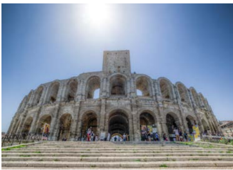
Willkommen in Arles