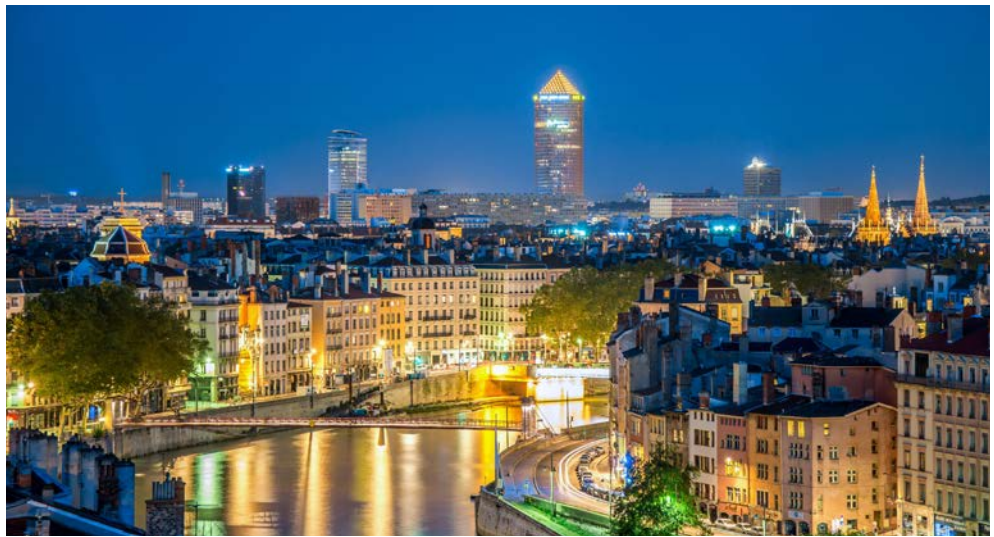
Freuen Sie sich auf die abendliche Panoramapassage durch Lyon an Bord Ihres A-ROSA Schiffes

Südfrankreich ist seit jeher ein Sehnsuchtsort für viele Reisende. Das Licht taucht die Landschaft in leuchtende Farben, die schon Picasso, Van Gogh und Henri Matisse inspirierte. Freuen Sie sich auf mediterranes Klima, köstliche Weine und eine fantastische Küche. Am schönsten kann man sich treiben lassen, wenn man sich um gar nichts kümmern muss – außer um die Aussicht vom Sonnendeck. Auf dem Wasser von Stadt zu Stadt, mal gegen den Strom, mal mit ihm. Vorbei an Landschaften, die aussehen wie gemalt. Der Duft der Provence – die malerische Lavendelblüte dauert bis ca. Mitte August – hervorragend zusammengestellte Landausflüge und das exquisite Leben an Bord von A-ROSA ... Sie werden sich fühlen wie „Gott in Frankreich!“ Ob Avignon oder Lyon, lassen Sie sich auf dieser Kreuzfahrt mit der A-ROSA LUNA und A-ROSA STELLA verzaubern. Die Rhône Route Méditerranée bringt Sie noch ein kleines Stückchen weiter nach Port St. Louis, nur wenige Kilometer entfernt vom Mittelmeer.