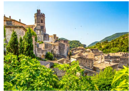
Viviers – auf den Spuren des Mittelalters

Abweichungen der A-ROSA LUNA: Avignon Tag 3, Arles Tag 4/5, Port St. Louis Tag 5 ab 13.00 Uhr