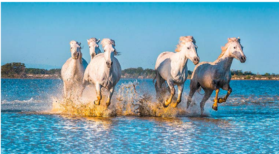
Die Pferde der Camargue

NEU: Getränkepaket Premium alles inklusive Plus zubuchbar zum Preis von € 19,- pro Nacht & Person (zusätzlich zu bereits inkludierten Getränken – ganztags Cocktails, Longdrinks und Spirituosen).