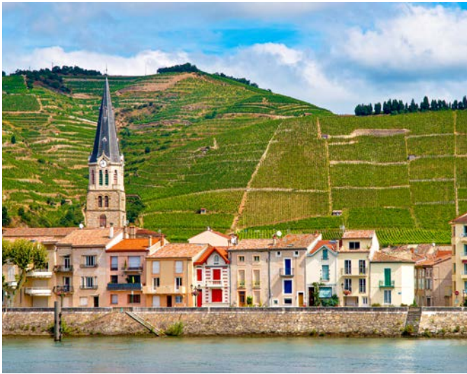
Blick auf Tournon und ...