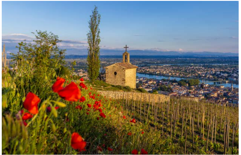
... die umliegenden Weinbaugebiete Tain-l'Hermitage