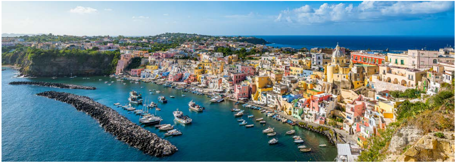
Einfach bezaubernd – der Blick auf Procida