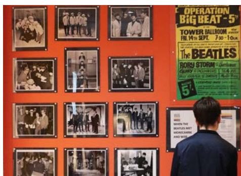
Das Beatles Museum

Flug nach Manchester, wo Sie von Ihrer örtlichen Reiseleitung in Empfang genommen werden. Ab jetzt fährt alles „andersherum“. Gewöhnen Sie sich daran auf Ihrem Transfer nach Liverpool. Auf einer geführten Stadtbesichtigung lernen Sie Liverpool, an der Mersey gelegen, kennen. Bei einem Besuch im Beatles-Museum tauchen Sie ein in die Welt der legendären Fab Four. Im Anschluss beziehen Sie Ihr Hotel für die nächsten zwei Nächte. Ein gemeinsames Abendessen beschließt den Tag.