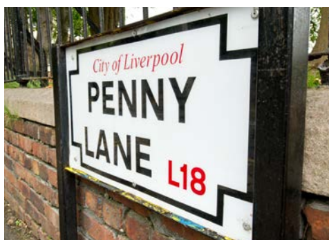
Mit dem Song „Penny Lane“ setzten die Beatles der Straße in Liverpool ein Denkmal