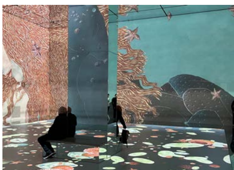
Frameless Immersive Art am Marble Arch

berühmtesten und historisch bedeutendsten Bauwerk Englands, The Westminster Abbey, gelangen. Sie besichtigen die Krönungskirche der englischen Monarchen und Begräbnisstätte gekrönter Häupter. Der Abend steht Ihnen für eigene Unternehmungen zur freien Verfügung.