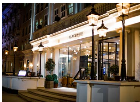
Das London Blackmore HydePark Hotel

Die Zimmer verfügen über Klimaanlage, Safe, Schreibtisch, Kühlschrank, Tee-/Kaffeemaschine, Bügelset, TV-Gerät und WLAN. Die Badezimmer sind mit Dusche, Badewanne und Föhn ausgestattet.