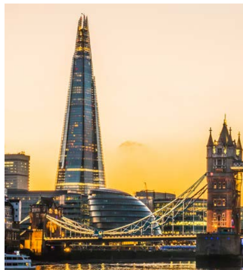
Beeindruckend – The Shard