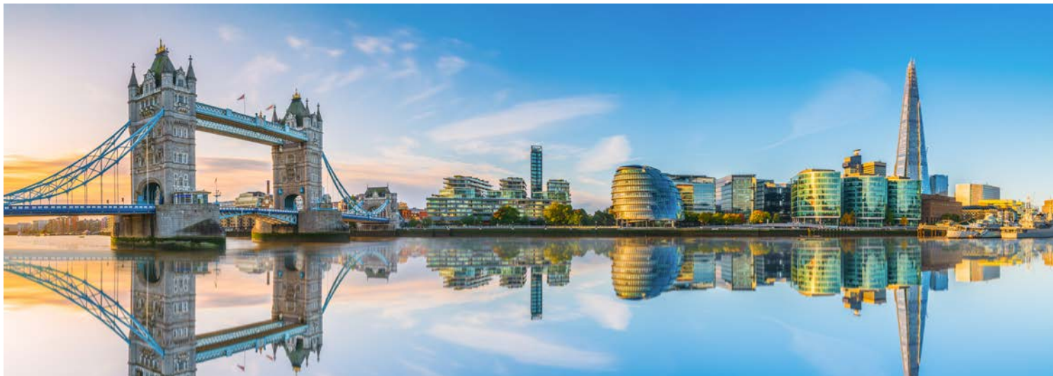
London zwischen Tradition und Hyper-Moderne