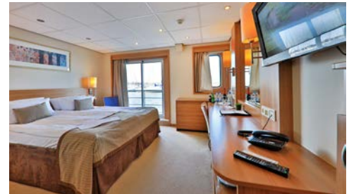
Kabinenbeispiel – Suite