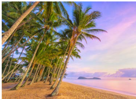
Palm Cove Beach

COVID-Hinweis: Für diese Reise gelten die für das Zielgebiet am Abreisetag gültigen Covid-19 Bestimmungen.