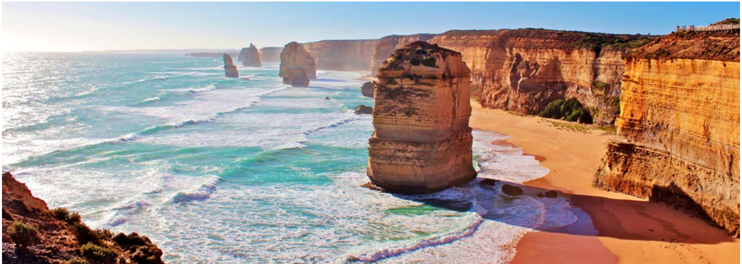
Die „Zwölf Apostel“ – Great Ocean Road