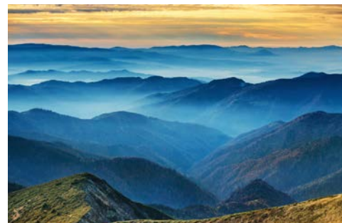
Die Blue Mountains