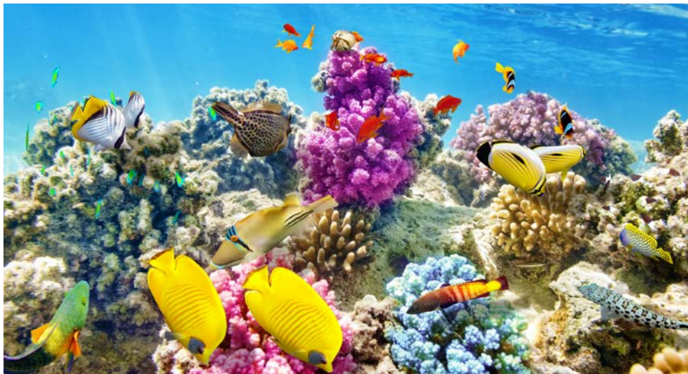
Great Barrier Reef

Kuranda, das inmitten des Regenwaldes, im kühlen Hochland gelegen ist. Vorbei an steilen Klippen, Schluchten und üppigem Dschungel zählt die Fahrt zu den eindrucksvollsten Zugfahrten Australiens. In Kuranda haben Sie die Möglichkeit über die Märkte und Geschäfte zu bummeln oder für Schmetterlingsliebhaber bietet sich die Schmetterlingsfarm, die tausende farbenprächtige Falter beheimatet an. Nach der Mittagspause „schweben“ Sie durch den Regenwald per „Skyrail Gondel“ zurück nach Cairns. Dort besuchen Sie das Pamagirri Aboriginal Experience wo Ihnen verschiedene Film- und Tanzvorführungen die Kultur der Ureinwohner näher bringen. Bei einem gemeinsamen Abendessen lassen Sie diesen erlebnisreichen Tag ausklingen.