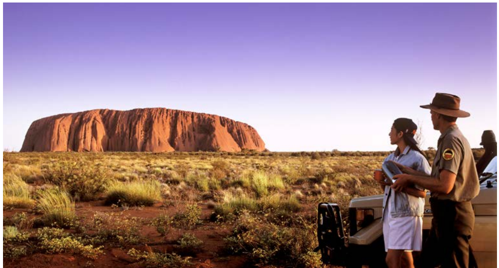
Ayers Rock (Uluru)

Ocean Road. Beginnend bei Torquay, wo die kühnen Wellenreiter auf die perfekte Welle warten, fahren Sie über die State Road 100 durch flaches Buschland nach Anglesea und weiter nach Apollo Bay. Eine faszinierende Küstenlandschaft, die überwältigende Panoramablicke, wunderschöne Buchten und den Ausblick u. a. auf die Steininformationen der „Zwölf Aposteln“ bietet. In Apollo Bay erwartet Sie ein gemeinsames Mittagessen. Rückkehr am späten Abend nach Melbourne.