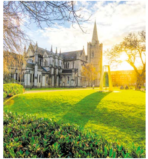
St. Patricks Cathedral in Dublin

Spaziergang hier ist ein besonderes Erlebnis. Erster Stopp ist das Burren Smokehouse, wo Sie in die Tradition der Lachs-Räucherkunst eingeführt werden – und den leckeren Lachs auch probieren können. Im Anschluss erreichen Sie die eindrucksvollen „Cliffs of Moher“, über 200 m senkrecht zum Atlantik abfallende Klippen. Weiterfahrt über Limerick nach Adare. Nach einem Rundgang durch dieses idyllische Dorf fahren Sie weiter zu Ihrem Hotel in der Region Kerry. 2 Nächte im River Island Hotel in der Region Kerry (Landeskategorie: 3 Sterne). Ca. 265 km