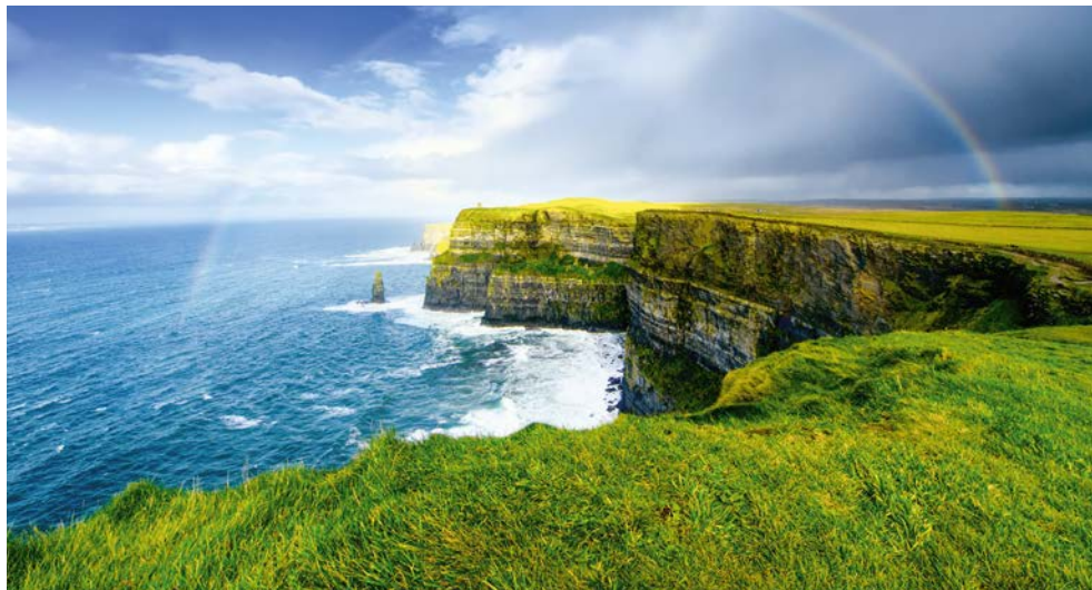
Cliffs of Moher

Was wäre eine Rundreise durch Irland ohne dessen Hauptstadt Dublin? Genau dort beginnt unsere Reise durch ein Land, das landschaftlich und kulturell so viel zu bieten hat wie kaum ein anderes! Erleben Sie Irlands einzigartigen „Wilden Westen“, wo die Natur ein bestechendes Panorama geschaffen hat. Entdecken Sie verwitterte Hochkreuze und alte Klosteranlagen aus frühchristlicher Zeit. Erfreuen Sie sich am satten Grün der Insel und am Anblick unzähliger blauer Seen. Traditionell gastfreundlich und aufgeschlossen sind die Bewohner Irlands. Wer einmal mit Iren in einem der „Singing Pubs“ zusammen saß, der weiß, dass dieses Volk zu feiern versteht.