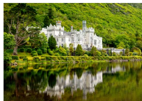
Kylemore Abbey in Connemara

Bevor die Reise Sie heute Richtung Westen führt, unternehmen Sie noch einen kurzen Stadtrundgang in Dublin. Dabei besuchen Sie die Sweny's Pharmacy, eine kleine ehemalige viktorianische Apotheke im Herzen des georgianischen Dublin, die vor allem durch das Buch Ulysses des irischen Nationaldichters James Joyce bekannt ist. Unterwegs besuchen Sie auch die 1213 erbaute anglikanische Saint Patrick's Kathedrale, auch die größte Kathedrale Irlands. Über die grünen Midlands fahren Sie an die Westküste