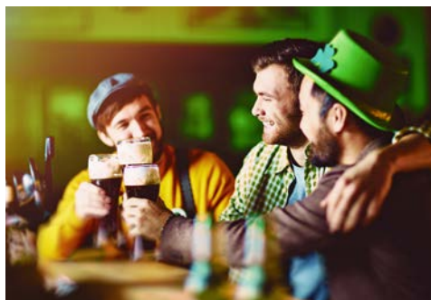
Herzlich willkommen in Irland

Am Vormittag verlassen Sie den Südwesten und fahren über Cork in die Ortschaft Midleton. Sie machen Halt in der berühmten Jameson Distillery. Nach einer Kostprobe legen Sie einen Fotostopp an den Ruinen des Rock of Cashel ein. Der 60 m hohe Felsblock überragt, gekrönt von einer mittelalterlichen Burganlage, die weite Ebene. Ihre Fahrt geht weiter in die „Marmorstadt“ Kilkenny, die Sie am besten bei einem Spaziergang kennenlernen. Wandeln Sie durch die mittelalterlichen, gewundenen Straßen und fühlen Sie sich in die Tudorzeit zurückversetzt. Die Nacht verbringen Sie im Springhill Courts Hotel in Kilkenny (Landeskategorie: 3 Sterne). Ca. 330 km