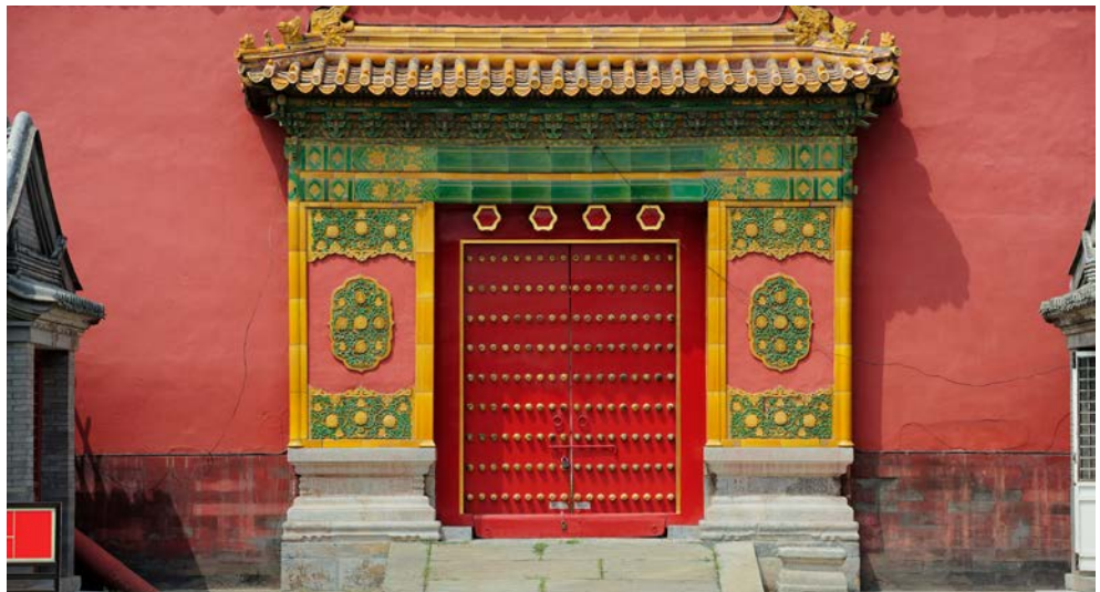
Das Tor zur „Verbotenen Stadt“