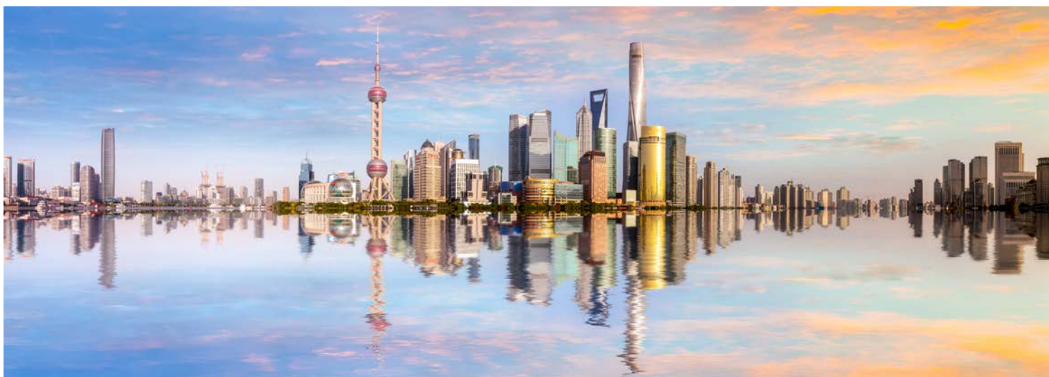
Die Skyline von Shanghai