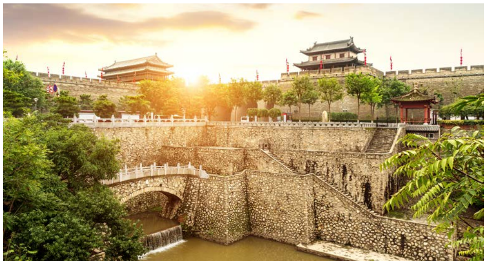
Die Stadtmauern von Xi'an