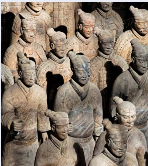
Besuchen Sie die Terrakotta-Armee

Erst Anfang der 70er Jahre wurde östlich von Xi'an die Terrakotta-Armee entdeckt. Der erste Kaiser der