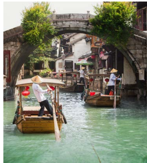
Das Wasserdorf Zhujiajiao

Mit der Magnetschwebbahn Transrapid fahren Sie in wenigen Minuten die etwa 30 km von der Longyang Metrostation zum Flughafen. (F)