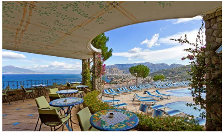
Traumhafter Ausblick von der Poolbar