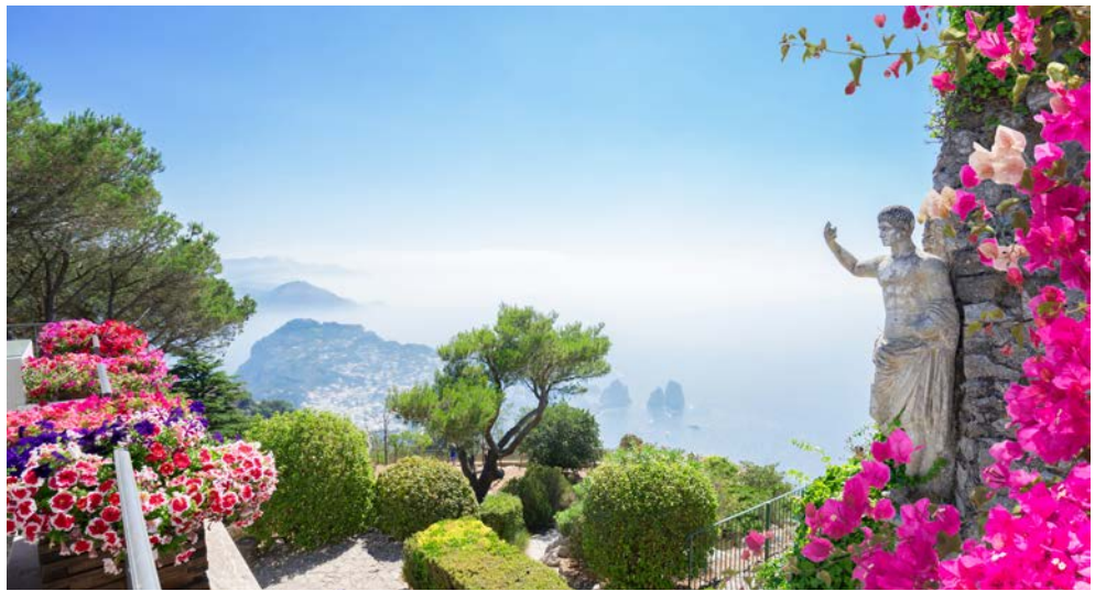
Capri – traumhafte Aussichten von den Augustusgärten

Seit Jahrhunderten inspiriert die Schönheit des Golfs von Neapel Literaten und Musiker aus ganz Europa. Die einzigartige Kulturlandschaft besticht durch prachtvolle Blütengärten, bizarre Felsformationen und ein azurblaues Meer. Verschlungene Küstenstraßen führen durch Orangen- und Zitronenhaine zu Stätten antiker Geschichte. Kampanische Bauern bewirtschaften ihre Gärten und Höfe in der zerklüfteten Küstenlandschaft seit Generationen. Ob Mozzarella oder Limoncello, hier kommen die Gaben der Natur direkt auf den Tisch. Über all dem thront der Vesuv, sagenhafter Mythos und Ehrfurcht erregende Naturgewalt. Idealer Ausgangspunkt, um diesen reizvollen Landstrich Kampaniens intensiv zu erkunden, ist Sorrent. Ein malerischer Ort, der imposant auf einem Felsplateau liegt. Ganz in der Nähe gründeten die Römer die mondäne antike Stadt Pompeji, deren durch Asche konservierte Architektur die Besucher noch heute in die untergegangene Kultur eintauchen lässt. Spätere Könige, Päpste und Fürsten prägten mit dem Bau gotischer Kirchen und barocker Prachtbauten die Altstadt von Neapel. In kleinen Bergdörfern überdauerten zudem die Bauwerke der Normannen und Mauren die Jahrhunderte. Und auf der wohl schönsten Insel des Tyrrhenischen Meeres, auf Capri, finden sich bis heute Spuren früher Bewunderer der einzigartigen Natur. Hier verbrachten im 19. Jahrhundert sowohl der schwedische Schriftsteller Axel Munthe als auch der deutsche Industrielle Friedrich Alfred Krupp ihre wohl schönsten Lebensjahre.