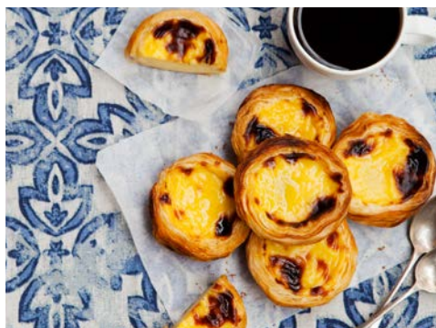
Pastel de Nata oder Pastel de Belém

Heute endet Ihre Reise leider schon. Transfer zum Flughafen und Rückflug.