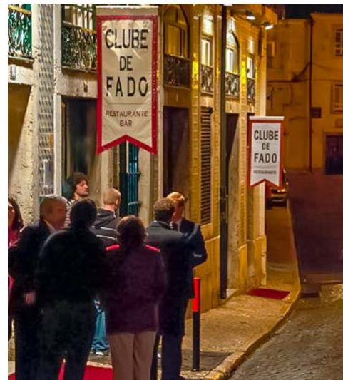
Beliebter Treffpunkt – Clube de Fado