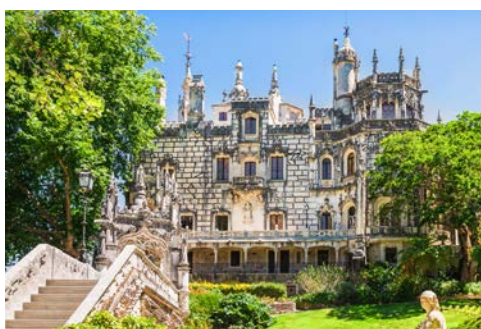
Das historische Anwesen Quinta da Regaleira in Sintra

Ein Geheimtipp ist noch der Palácio e Quinta da Regaleira, ein extravagantes gotisches Herrenhaus aus dem 19. Jh., das von einigen der schönsten Gärten Sintras umgeben wird. Erkunden Sie die Gärten, denn sie sind voller dekorativer Befestigungen, mystischer religiöser Symbole und einer Reihe geheimer Passagen und Grotten. Die Hauptattraktion ist der Brunnen der Initiation, der trockengelegt, vergrößert und möglicherweise für Kultzeremonien genutzt wurde. Nach der Führung fahren Sie weiter entlang der Küste mit Blick auf die Weiten des Atlantik und die herrlichen Stränden nach Cascais. In dem mondänen Küstenstädtchen erwartet Sie ein Mittagessen mit einem herrlichen Blick aufs Meer. Gut gestärkt fahren Sie anschließend zum Cabo da Roca, dem südwestlichsten Punkt des europäischen Festlandes. Die Ankunft in Lissabon erfolgt am frühen Abend.