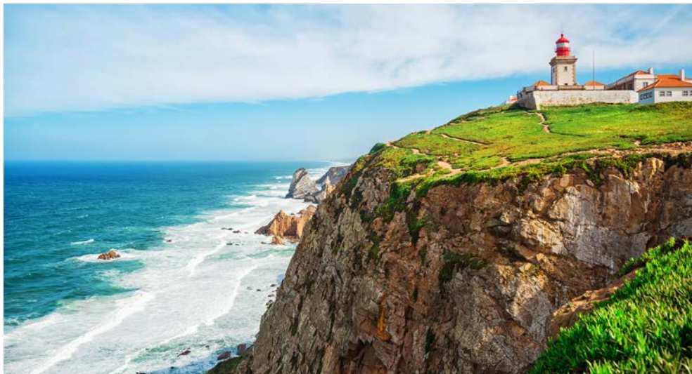
Cabo da Roca – der westlichste Punkt Europas