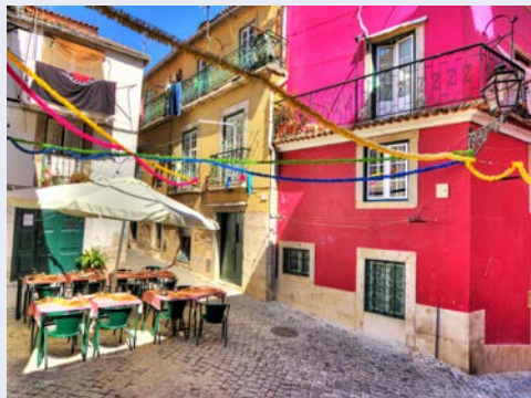
In den Straßen von Alfama