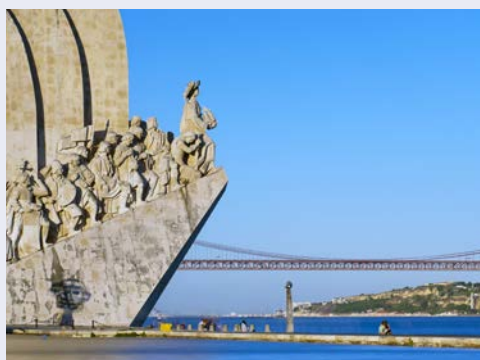
Das Denkmal der Entdeckungen direkt am Tejo