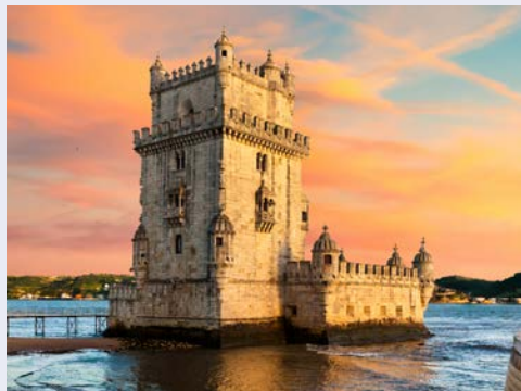
Der Turm von Belém

Freuen Sie sich auf die Erkundung des Expo-Geländes von 1998, schlendern Sie über die Prachtstraße Avenida Liberdade oder horchen Sie beim Blick über den Tejo in sich hinein, ob auch in Ihnen der sehnsuchtsvolle Klang des Fados erklingt. Zudem führt Sie ein optionaler Ausflug nach Sintra mit seinen königlichen Palästen und nach Cabo da Roca.