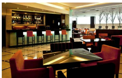
Vintage Club Bar