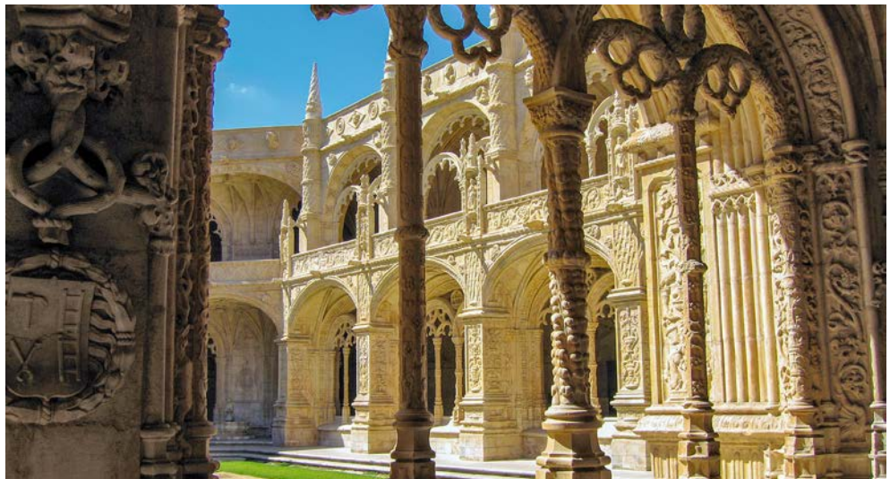
Mosteiro dos Jerónimos