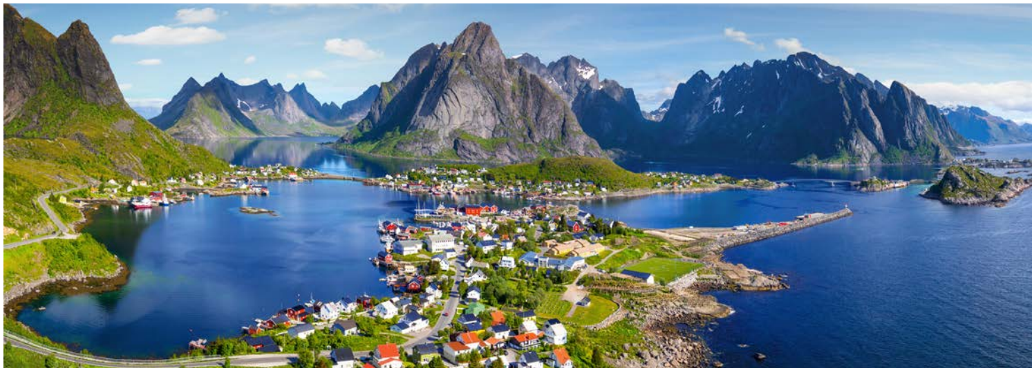
Welch fantastische Kulisse – Reine auf den Lofoten