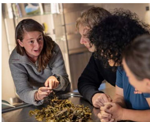
Im Science Center an Bord