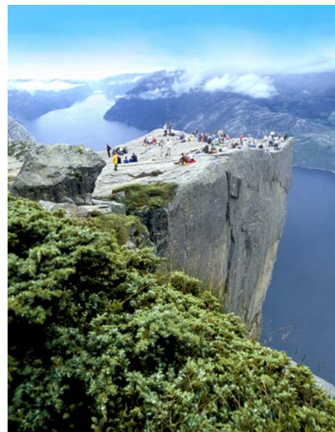
Traumhafte Fjordlandschaften (Preikestolen)