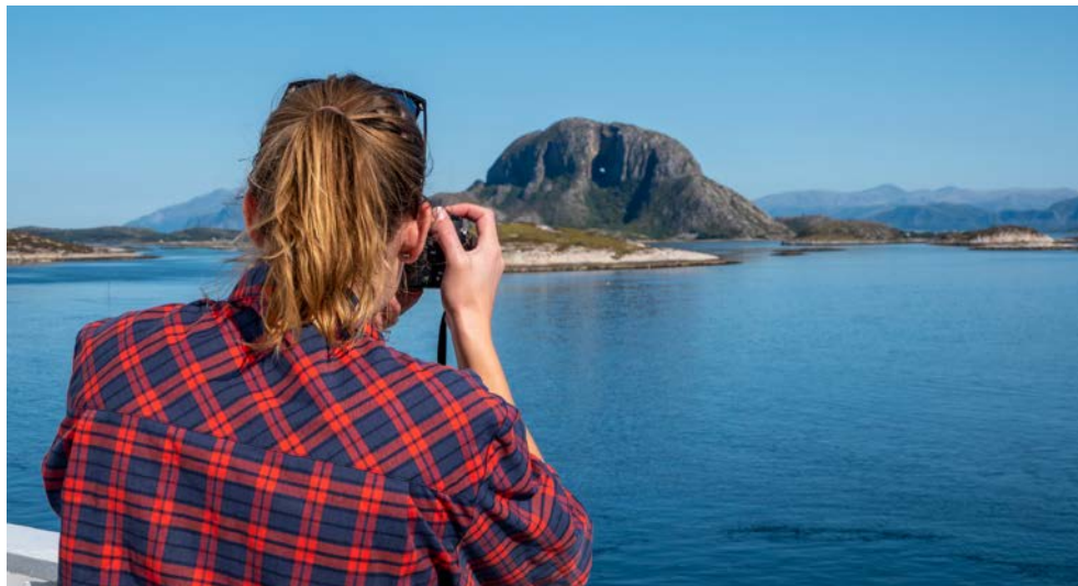
Spektakuläre Panoramen erwarten Sie

Gehen Sie an Bord der OTTO SVERDRUP und erkunden Sie im Sommer die herrliche Küste Norwegens bis weit über den nördlichen Polarkreis hinaus, mit fachkundiger Begleitung eines Expertenteams. Das hochmoderne Schiff besticht durch eine neue, umweltschonende und nachhaltige Hybrid Technologie. Mit seinem deutlich reduzierten Kraftstoffverbrauch zeigt es der Welt, dass Hybridantriebe bei großen Schiffen möglich sind. Auf dieser Reise sehen Sie nicht nur die weltberühmten Sehenswürdigkeiten Norwegens wie das UNESCO-geschützte Bryggen in Bergen und den nördlichsten Punkt des europäischen Festlandes, sondern erkunden auch verborgene Schätze entlang der Küste. Sie werden sich schnell verlieben – in die mit kleinen Holzhäuschen gesprenkelten Buchten, die beschaulichen Fischerdörfer und die wunderschönen Inseln, die so abgelegen sind, dass Sie das Gefühl haben, Sie hätten sie soeben selbst entdeckt.