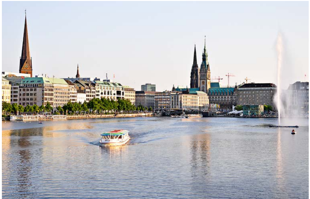
Blick auf das Hamburger Rathaus