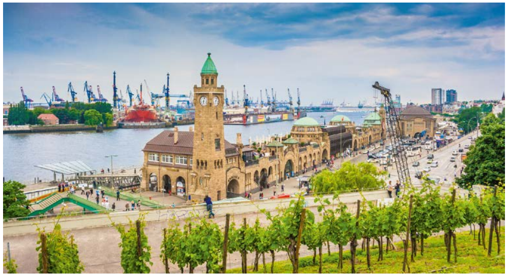
Blick auf die Landungsbrücken

»Meine Seele muss sich glücklich singen«, sagt der Tenor Rolando Villazón. Er zählt zu den führenden Künstlern unserer Zeit und begeistert weltweit mit einzigartig fesselnden Auftritten voller Energie und Hingabe. Erleben Sie den Star-Tenor anlässlich des Internationalen Musikfestes Hamburg im Großen Saal der Elbphilharmonie, denn hier ist der Besuch eines Konzertes immer wieder ein herausragendes Erlebnis. Unumwunden ist es auch ein besonderer Moment, wenn die ersten Takte, Rhythmen und Akkorde von der Mitte der Bühne aus ihren klangvollen Weg durch die wie ein Weinberg angelegten Zuschauerreihen finden und dem großen Konzertsaal musikalisches Leben einhauchen. Dazu haben wir ein buntes, abwechslungsreiches und frühsummerliches Hamburg-Programm organisiert, um Ihnen wieder ganz besondere Orte zu zeigen, denn das "Tor zur Welt" hat auch für Wiederkehrer immer wieder neue Sehenswürdigkeiten und Einblicke parat.