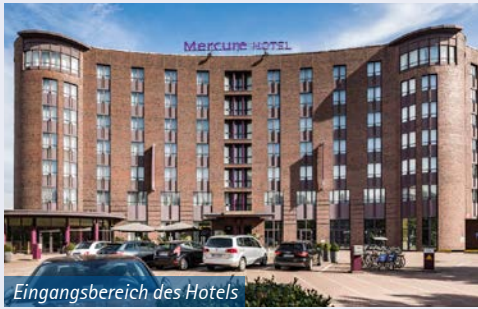
Eingangsbereich des Hotels