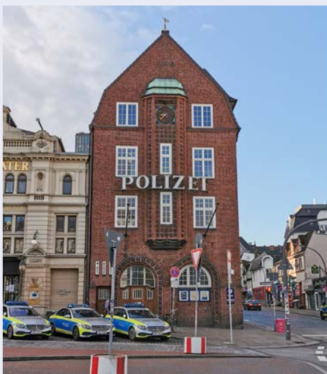
Die bekannte Davidwache

Nach dem Frühstück werden Sie um 10 Uhr zu einer ganz besonderen Erlebnisrundfahrt durch den Hamburger Hafen erwartet. Der Hafen Hamburg ist eine Welt für sich und Besucher kommen hier normalerweise nicht auf das riesige Gelände. Mit einer speziellen Sondergenehmigung der Hafenbehörde geht es per Bus samt Begleitfahrzeug und blinkenden Warnleuchten direkt auf die Terminals. Werfen Sie