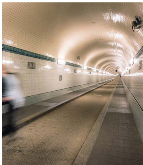
Der alte Elbtunnel