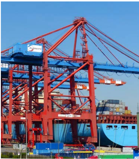
Bekommen Sie einen Einblick in die Hafenwelt

einen Blick hinter die Kulissen und entdecken Sie das gewaltige Hafengebiet mit riesigen Be- und Entladestationen, computergesteuerten und komplett fahrerlosen Transportplattformen sowie der neuesten Generation von Containerbrücken. Immer dabei: Ein fachkundiger Guide, der alle Informationen rund um Technik und Abläufe parat hat und natürlich gern Ihre Fragen beantwortet. Zurück im Hotel steht der Nachmittag noch einmal für eigene Erkundungen zur Verfügung, bevor Sie um 17 Uhr direkt an den Landungsbrücken eine exklusiv für Sie gecharterte Barkasse besteigen. Sie werden mit einem Glas Prosecco begrüßt und bei stimmungsvoller Hintergrundmusik machen Sie eine zweistündige Fahrt auf der Elbe, durch den Hafen und die Speicherstadt. Unterwegs genießen Sie ein reichhaltiges kalt/warmes Buffet und die sommerliche Abendstimmung auf dem Wasser. Die Fahrt endet direkt am Anleger der Elbphilharmonie. Hier erhebt sich der gläserne Neubau mit seiner kühn geschwungenen Dachlandschaft. Er birgt zwei Konzertsäle, ein Hotel und Apartments. Im Großen Saal, dem Herz der Elbphilharmonie, erleben Sie ab 20 Uhr "Musikalische Seelenreise" von Rolando Villazón und der Lautten Compagny Berlin anlässlich des Internationalen Musikfestivals Hamburg. Keine Stadt von Welt, die er noch nicht besungen hat, kein Festival, bei dem er nicht Stargast war. Rolando Villazón ist aber nicht nur