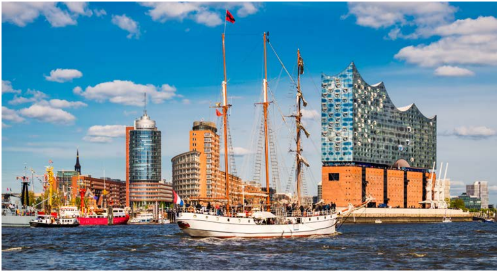
Die Elbphilharmonie wartet bereits auf Sie