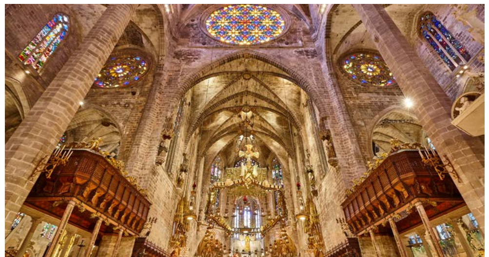
Besuchen Sie die Kathedrale von Palma „La Seu“