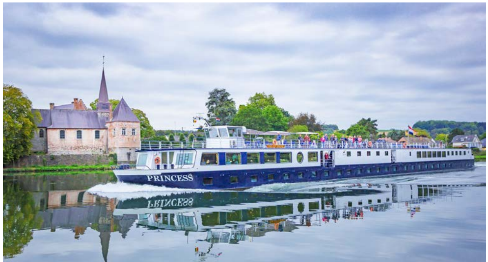
Die PRINCESS erwartet Sie

Von der alten Hansestadt Stralsund fahren Sie entlang der einzigartigen Boddenküste zu den größten Inseln Deutschlands, nach Rügen und nach Usedom. Durch das Oderhaff kommen Sie ins polnische Stettin mit dem prachtvollen Schloss. Weiter geht es durch die ruhige und einmalige Oder-Landschaft nach Schwedt und dann auf dem Oder-Havel-Kanal über Eberswalde und Oranienburg durch ausgedehnte Wälder bis zu Ihrem Reiseziel, der Weltstadt Berlin. Was kann wohl schöner sein als auf Radtouren viel Interessantes über Land und Leute, Kultur und Natur zu erfahren und im Anschluss wieder auf Ihr „schwimmendes Hotel“ zu gehen? Entdecken Sie die vielfältige Flora und Fauna dieser einzigartigen Flusslandschaften, barocke Schlösser, Backsteingotik und norddeutsche Bäderarchitektur.