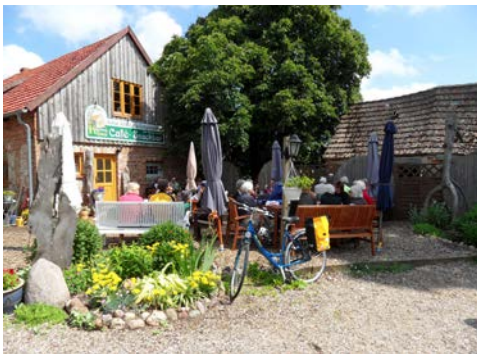
Eine kurze Pause zwischendurch