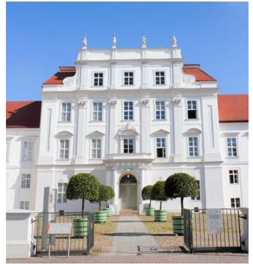
Barockschloss in Oranienburg