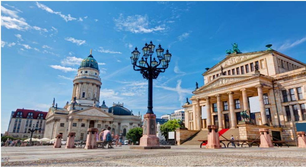
Unverkennbar – der Gendarmenmarkt in Berlin