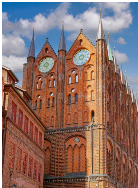
Rathaus in Stralsund

Anreise wie ausgeschrieben nach Stralsund. Vielleicht haben Sie noch Lust auf einen Spaziergang durch die Altstadt Stralsunds, die auf einem Inselchen liegt. Als Stadt mit bedeutender Vergangenheit werden Sie immer wieder auf außergewöhnliche Sehenswürdigkeiten treffen.