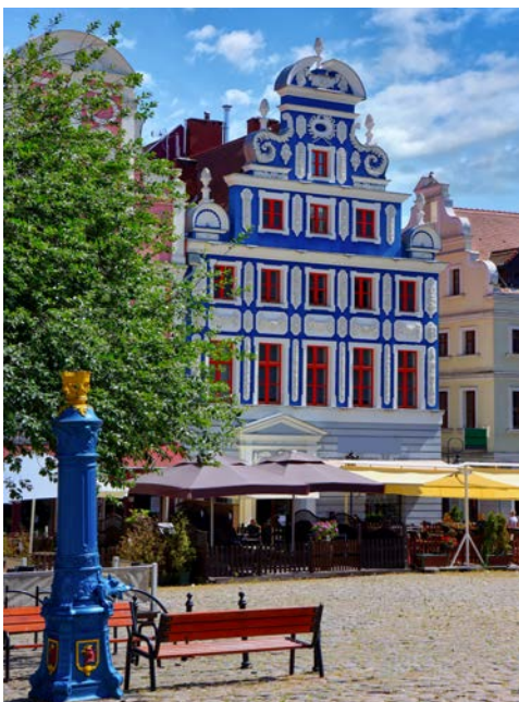
Wunderschön restaurierte Fassaden in Stettin

Entspannung pur: Sie verbringen den ganzen Tag an Bord. Sie durchqueren die weitläufige Wasserfläche des Stettiner Haffs (Oderhaff) und erreichen Stettin, die grüne Großstadt an der Odermündung und einer der größten Häfen an der Ostsee. Sehenswert ist das in der Altstadt liegende, rekonstruierte Schloss der Herzöge von Pommern.