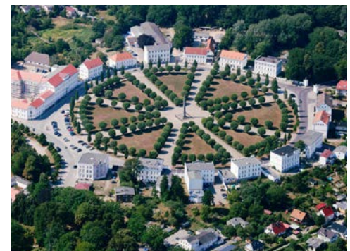
Der „Circus“ in Putbus