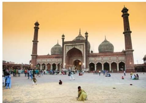
Die Moschee Jama Masjid in Delhi

Weiterreise zur verlassenem Siegesstadt Fatehpur Sikri, die Mogulkaiser Akbar im 16. Jh. als neue Hauptstadt erbauen ließ. Nach der Besichtigung gemeinsames Mittagessen und Weiterreise nach Agra, die ehemalige Hauptstadt des Mogulreiches. Hier besuchen Sie das Wahrzeichen Indiens – das Taj Mahal. Nach dem Tod seiner geliebten Frau Mumtaz Mahal wurde es von Shah Jahan erbaut und berührt nach fast 400 Jahren noch immer in seiner Schönheit die Herzen der Besucher. Von der Gartenanlage aus betrachtet, gewährt sich ein unvergesslicher Anblick auf die feinen Proportionen des prunkvollen Mausoleums. Übernachtung im Hotel. (F, M, A) (ca. 245 km)