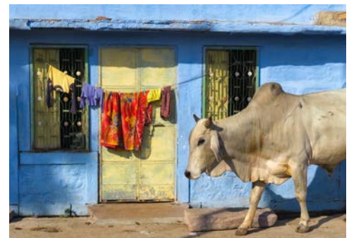
Auf den Straßen Jodhpurs

Weiterreise nach Bhenswara. Auf einer Jeepsafari erhalten Sie einen Einblick in die traditionelle Lebensweise der Landbevölkerung. Im Dorf besuchen Sie eine Schule, einen Bauernhof und den lokalen Markt, auf dem die einheimischen Volksstämme ihre Waren handeln. Bestaunen Sie die Bewohner in ihren Trachten. Sie übernachten im Heritage Hotel. (F, A) (ca. 125 km)