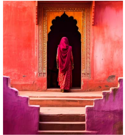
„Pink City“ – Jaipur