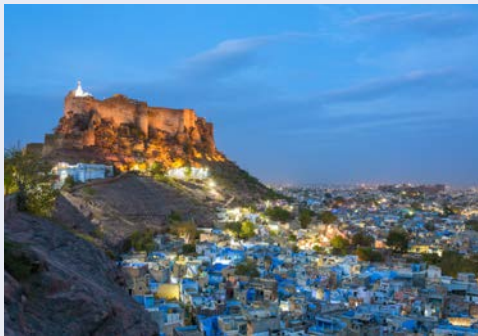
Jodhpur – Fort Mehrangarh

Bitte beachten Sie: Für die Flüge und Bahnfahrten gilt: Umsteigeverbindungen möglich; Flüge in der Economy Class; Bahnfahrten mit Sitzplatzreservierung.