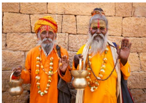
Willkommen in Indien

Fahrt in die „blaue Stadt“ Jodhpur, eine der romantischsten Städte Indiens. Die Stadtrundfahrt beginnt