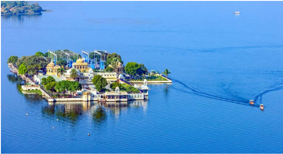
Eine Bootsfahrt auf dem Pichola-See eröffnet in Udaipur grandiose Ausblicke