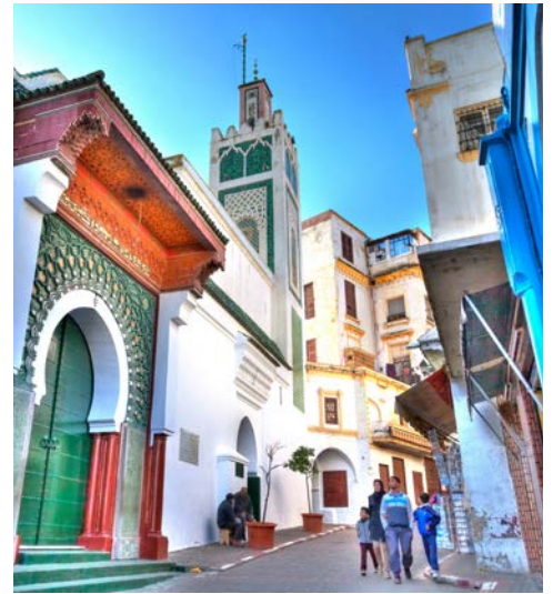
Die Große Moschee im Herzen der Medina von Tanger