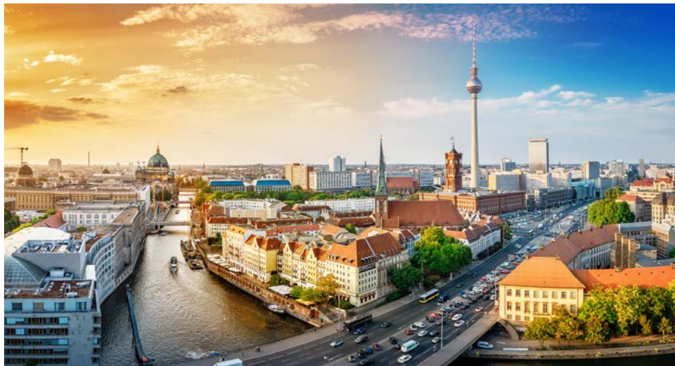
Erleben Sie das politische Berlin

Als Hauptstadt Deutschlands spielt Berlin eine wichtige Rolle in der nationalen Politik des Landes, dabei hat kaum eine Hauptstadt eine so dramatische Geschichte hinter sich wie Berlin. Im Krieg stark zerstört, geteilt, abgeschnitten von der Außenwelt und nun wieder lebendige Hauptstadt der Bundesrepublik Deutschland. Das politische Leben in Berlin ist geprägt von den Institutionen und Regierungsbehörden, die hier ansässig sind. Eines der wichtigsten politischen Organe ist der Deutsche Bundestag, das Parlament der Bundesrepublik Deutschland, das im Reichstagsgebäude in Berlin tagt. Hier werden die Gesetze und politischen Entscheidungen für das Land getroffen. Begleiten Sie uns auf eine spannende Spurensuche in die Hauptstadt, in der wir Ihnen die Türen zu verschiedenen politischen Einrichtungen öffnen und ein abwechslungsreiches Programm rund um die Politik für Sie vorbereitet haben.