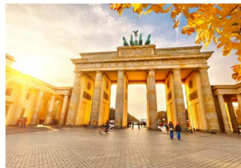
Das Brandenburger Tor