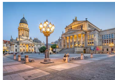
Gendarmenmarkt mit dem Deutschen Dom

Nach dem Frühstück werden Sie um 09.30 Uhr abgeholt und begeben sich auf eine Stadtrundfahrt. Sie werden dabei besonderes Augenmerk auf das Regierungsviertel haben. Mit einer Gesamtfläche von 12.000 m 2 ist es eines der größten Regierungshauptquartiere der Welt und rund achtmal größer als das Weiße Haus in Washington. Rund um den Reichstag und das Bundeskanzleramt bilden die Neubauten das imposante „Band des Bundes“. Um 12.30 Uhr erwartet man Sie im Deutschen Dom auf dem Gendarmenmarkt und Sie besuchen die Parlamentshistorische Ausstellung des Deutschen Bundestages und den original nachgebauten Plenarsaal aus dem Reichstagsgebäude. Die Ausstellung zeigt die historische Entwicklung des Parlamentarismus in Deutschland.