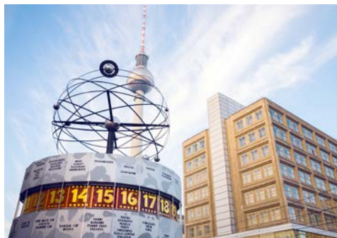
Alexanderplatz in Berlin

In Berlin angekommen, lernen Sie mittags Ihre Berliner Gästeführerin kennen, die Sie in den nächsten Tagen begleiten wird. Sie ist eine waschechte Berlinerin und wird Ihnen die politische Hauptstadt zeigen, hält aber natürlich auch viele Anekdoten und Geschichten für Sie bereit. Gemeinsam werden Sie um 14.00 Uhr in der Landesvertretung Bremen zu einem Gespräch empfangen, denn Landespolitik entscheidet sich nicht nur in Bremen. Interessen gegenüber dem Bund brauchen eine eigene Vertretung in Berlin. Wichtige Unternehmen des Landes präsentieren sich und knüpfen Kontakte zu Politikern, Behörden, Botschaftsvertretern und Organisationen.