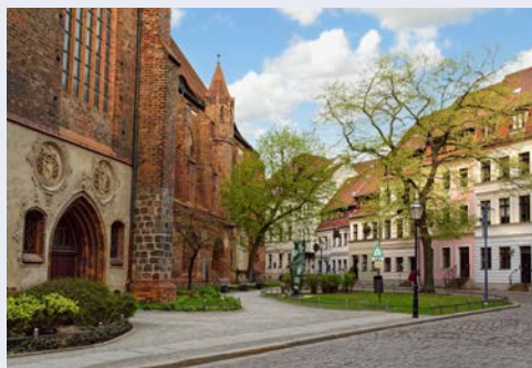
Nikolaiviertel in Berlin

Hier werden intensive Kontakte zu den Institutionen des Bundes und Europas, zu Ministerien, Kommissionen, Parlamenten oder Verbänden gepflegt. Man erklärt Ihnen die Arbeitsweise und Aufgaben der Landesvertretung und steht Ihnen für Fragen zur Verfügung. Im Anschluss beziehen Sie Ihre Hotelzimmer direkt am Alexanderplatz und begeben sich ab 17.00 Uhr auf einen Spaziergang rund um den Alexanderplatz, entlang des Roten Rathauses und durch das Nikolaiviertel, dem historischen Kern Berlins, in dessen Zentrum die Nikolaikirche liegt. Nur der Fernsehturm über den Dächern erinnert Sie noch daran, dass das Nikolaiviertel keine romantische Kleinstadt ist, sondern mitten im quirligen Berlin liegt. Doch seine mittelalterlich anmutenden Gassen und gemütlichen Häuschen sind zum größten Teil Bauten der Nachkriegszeit. Nach dem Rundgang kehren Sie um 18.30