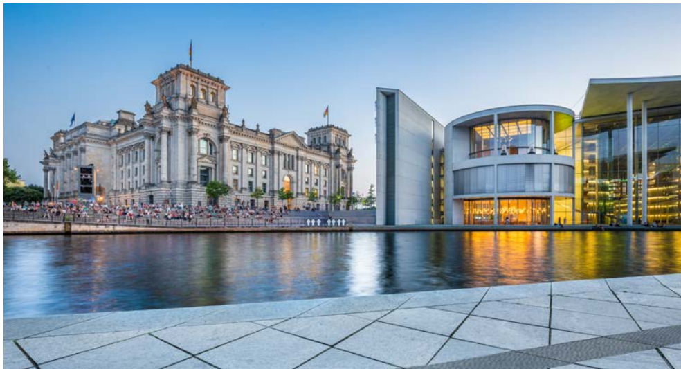
Das Berliner Regierungsviertel