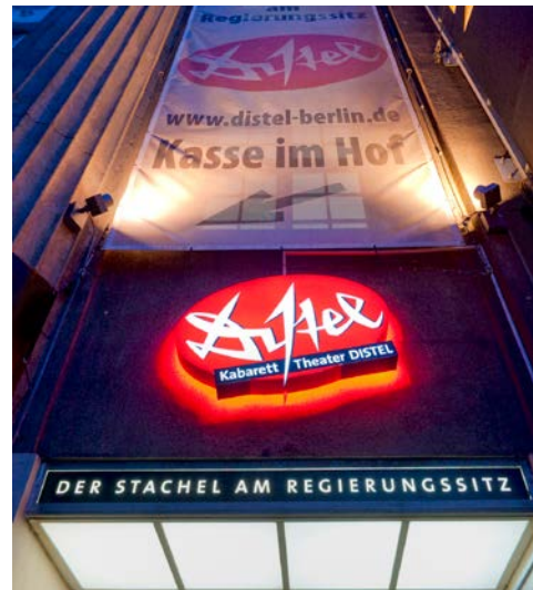
„DISTEL“ präsentiert Ihnen politisches Kabarett

sich ein stilvolles Ambiente für feine und rustikale Gaumenfreuden etabliert. Der Stil der 20er Jahre und traditionelle Gastlichkeit finden sich hier seit über 100 Jahren. Im Anschluss besuchen Sie um 19.30 Uhr das größte Ensemble-Kabarett Deutschlands. Längst legendär gilt DISTEL heute deutschlandweit als erste Adresse für politische Satire. Die Nähe zu Reichstag und Kanzleramt begreift sie als Anreiz, der scharfe „Stachel am Regierungssitz“ zu sein. Bereits seit 70 Jahren unterhält die stachelige DISTEL mit spitzem Humor.