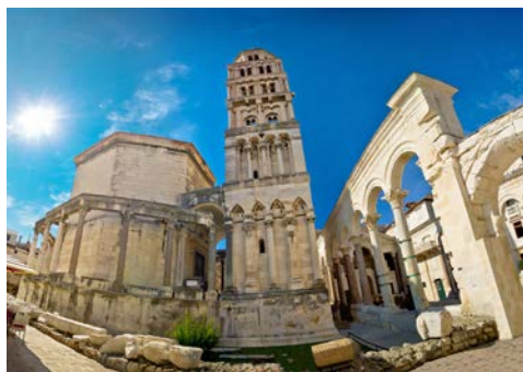
Diokletian-Palast in Split

Tagen können Sie auf dem alten Bazar, in zahlreichen Moscheen und in einem typischen türkischen Haus entdecken. Sie nehmen Ihr landestypisches Mittagessen inkl. Getränke in einem Restaurant ein, welches Ihnen einen traumhaften Blick auf die weltbekannte Brücke „Stari Most“ bietet. Von der Brücke stürzen sich auch öfter tollkühne Springer spektakulär in die Fluten des Flusses. Auf dem Rückweg legen Sie noch einen Stopp in Pocitelj ein, einer einst malerischen im türkischen Stil erbauten Festungsanlage.