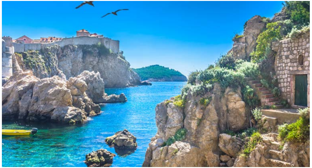
Blick auf Dubrovnik

Die adriatische Küste Kroatiens ist mindestens so schön wie die italienische Adria oder die Riviera. Viele Kenner sagen, sie sei, vor allem wegen der vorgelagerten Inseln, noch weitaus schöner. Die Uferstraße, die „Adria Magistrale“, ist das mit Abstand Großartigste, was die Straßenbauer an irgendeiner Küste jemals angelegt haben. Klug und kühn ausgedacht, führt sie an alten Hafendörfern und verträumten Fischerdörfern, an zerklüfteten Buchten und endlosen Badestränden vorbei. Selten verliert man das Meer aus dem Auge – und wenn, dann nur, weil die Straße ein besonders klotziges Bergmassiv umrunden muss, um dann gleich wieder einen zauberhaften Blick auf die nächste Bucht freizugeben. Wer diese Magistrale einmal in ihrer ganzen Länge gefahren ist, die unendlich vielen Buchten gesehen hat und im Geist auch noch die vielen hundert Inseln hinzuzählt (alles in allem beträgt die Küstenlinie über 6.000 Kilometer), der kann sich ausrechnen, dass hier alle Feriengäste der Welt Platz hätten.