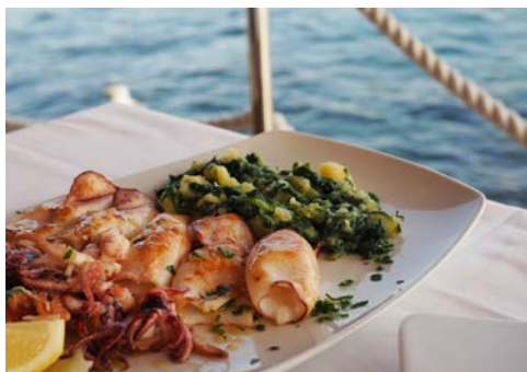
Wie wäre es mit einer Köstlichkeit aus dem Meer?