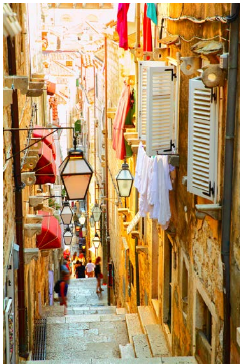
In den Gassen von Dubrovnik