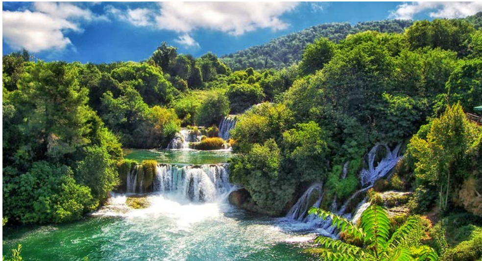
Wasserfälle im Krka Nationalpark