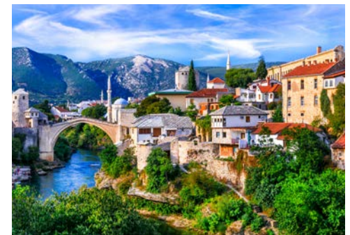
Friedensbrücke in Mostar

Heute fahren Sie nach Bosnien-Herzegowina. Ihr Kurs geht nordwärts bis Neum. Von hier aus geht die Fahrt weiter ins Landesinnere. Auf dem Weg nach Mostar durchfahren Sie das fruchtbare Neretvatal. Der Aufenthalt in Mostar gilt der Besichtigung der Stadt, die einst während der Herrschaft des Osmanischen Reiches ein Handelsmittelpunkt war. Spuren aus diesen