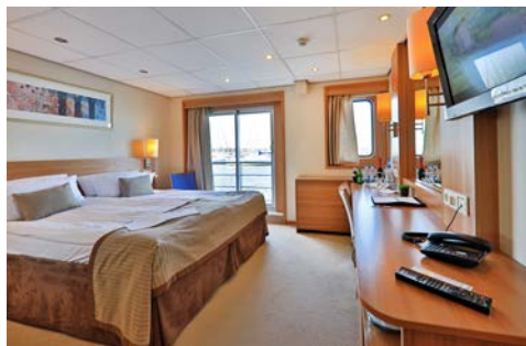
Kabinenbeispiel – Suite

Einige Stops dienen nur der Ausflugsabwicklung