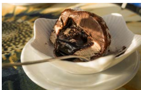
Köstliches Tartufo in Pizzo

Frühstück im Hotel. Tropea und Capo Vaticano sind die zwei wertvollsten Juwelen der tyrrhenischen Küste Kalabriens. Sie besichtigen Tropea, die antike römische Stadt „Tropis“. Der Name dieser Stadt wird von Plinius dem Alten im 1. Jahrhundert n. Chr. zum ersten Mal erwähnt. Zu den ältesten Gebäuden im historischen Zentrum gehört die Kathedrale aus der normannischen Zeit. Im Inneren befinden sich wichtige Kunstwerke, wie z. B. das Gemälde der Muttergottes von Rumänien, Schutzpatronin von Tropea. Sie fahren weiter nach Capo Vaticano. Hier können Sie eine der schönsten Ecken der Welt, den berühmten Leuchtturm „Faro“, besuchen, von dem aus