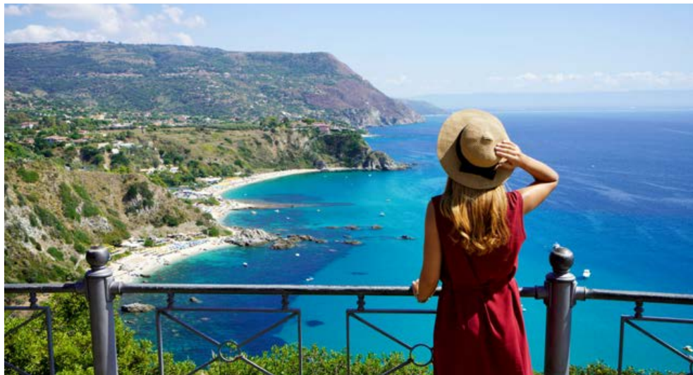
Blick auf das Capo Vaticano

Schon ein erster Blick auf die Landkarte genügt, um zu erahnen, was Kalabrien alles zu bieten hat. Von zwei Meeren umspült hält die schmale Landzunge eine große Anzahl an Sehenswürdigkeiten und Attraktionen bereit, die die Region zwischen Sohle und Spann des Stiefels gleichermaßen zu einem interessanten sowie abwechslungsreichen Reiseziel macht. Wer die Spitze des italienischen Stiefels bereist, dem sind nicht nur viele Sonnenstunden sicher, sondern den erwarten zudem eine Fülle von Naturschönheiten und kulturellen Schätzen.