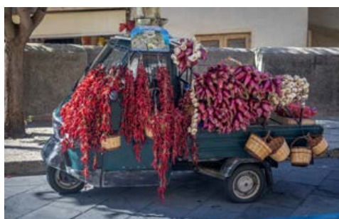
Berühmt: die roten „Tropea-Zwiebeln“