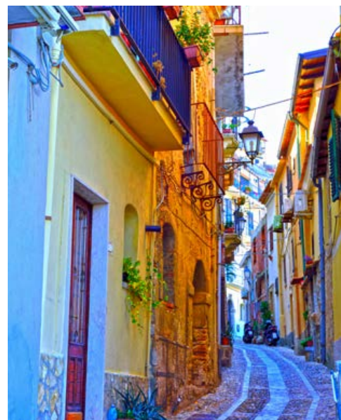
Gasse in Scilla