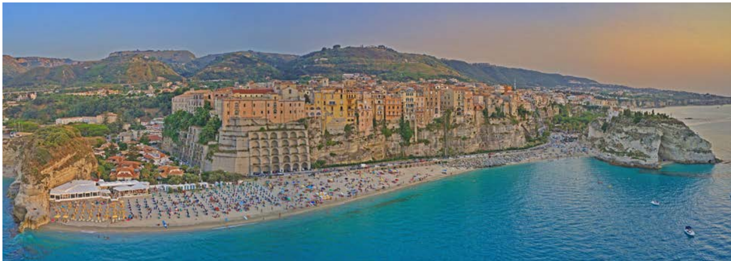
Hier – in Tropea – werden Italien-Träume wahr