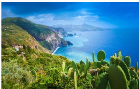
Küste von Lipari

Frühstück im Hotel. Heute unternehmen Sie – wenn Sie mögen – einen Ausflug zu den Liparischen Inseln, welche nördlich vor Sizilien liegen. Sie sind vulkanischen Ursprungs und gehören zu den schönsten im Mittelmeer. Fernab von Stress und Hektik erwartet Sie hier neben jahrtausendalter Geschichte ein Farbenspiel und eine Naturlandschaft par excellence. Während der Schifffahrt bieten sich wunderbare Blicke auf die Vulkane, hohen Klippen und weiß/schwarzen Strände der Inseln Lipari und Vulcano. Rückfahrt zum Hotel. Abendessen und Übernachtung im Hotel.