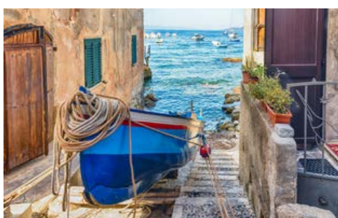
Pittoresk – Alltag in Scilla