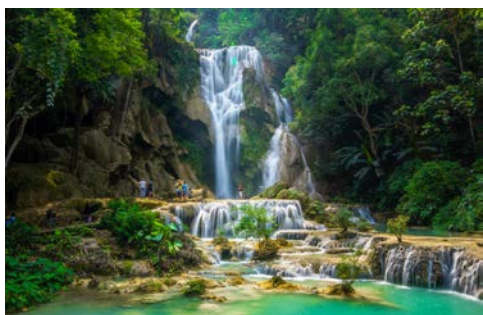
Die Wasserfälle von Kuang Si

Heute besuchen Sie einen bei den Einheimischen sehr beliebten Park mit den malerischen Kuang Si-Wasserfällen. Die türkisblauen Pools zwischen den einzelnen Kaskaden inmitten der üppig-grünen Vegetation laden vor allem an heißen Tagen zu einem erfrischenden Bad ein. Ihr Schiff schlängelt sich dann weiter südwärts. Sie passieren per Schleuse eines der größten Bauprojekte in Laos, den imposanten Staudamm bei Xayaburi. Abends ankert Ihr Flusskreuzfahrtschiff an einer Sandbank oder am Ufer, wo Sie Ihr Abendessen an Bord inmitten ursprünglicher Natur genießen. (F/M/A)