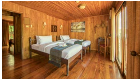
Kabinenbeispiel Deluxe, Mekong Pearl

Dies ist wohl die authentischste und komfortabelste Art, Laos und das Leben seiner Einwohner entlang des Mekongs zu erkunden. Sie reisen an Bord Ihres stilvollen Flusskreuzfahrtschiffes MEKONG PEARL in exklusiver, privater Atmosphäre. Ihr Schiff bietet 15 Kabinen auf zwei Decks. Alle Kabinen im Kolonialstil befinden sich in Außenlage, sind klimatisiert, mit privater Dusche und Toilette ausgestattet sowie mit dem besten Bord-TV der Welt: Panoramafenster mit Mekong-Blick. Die maximal 29 Gäste werden von den 18 Mitarbeitern der Schiffs-Crew bestens betreut. Auf dem Oberdeck befinden sich das geschlossene Restaurant und der Barbereich sowie ein separates Sonnendeck mit ausfahrbarer Überdachung und Getränke-Service. Auf dem Hauptdeck lädt das kleine Spa zum Relaxen ein. Freuen Sie sich auf eine entspannte Atmosphäre, die Sie auf anderen Kreuzfahrtschiffen vergeblich suchen!