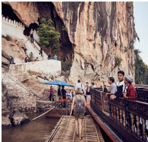
Die Pak-Ou Höhlen

Lehnen Sie sich zurück und genießen Sie bequem vom Sonnendeck oder von Ihrer Kabine aus die eindrucksvollen Flusspanoramen am Mekong. Bei gutem Wetter können Sie heute wieder eine kurze Wanderung zu noch weitgehend unentdeckten Höhlen unternehmen. In Ihrer Freizeit können Sie auf dem Sonnendeck entspannen oder den kurzweiligen Bordvorträgen lauschen. Auf unterhaltsame Weise erfahren Sie auch Details zur Geschichte von Laos und seiner Bevölkerung. Vielleicht möchten Sie ja auch an einer Obstverkostung an Bord teilnehmen? (F/M/A)