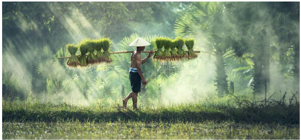
Ganz traditionell – ein Reisfarmer in Laos