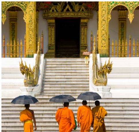
Alte Tempel und Mönchsrituale in Luang Prabang

feilgeboten wird. Achtung, der Besuch ist nur etwas für starke Mägen! Der restliche Tag steht Ihnen für eigene Streifzüge zur Verfügung. Erkunden Sie die Gegend zu Fuß oder mit dem Miet-Fahrrad. Sie können auch einen Einkaufsbummel unternehmen, das Flair der Stadt in einem der zahlreichen Cafés aufsaugen oder einen Ausflug in die Umgebung machen. Anschließend nehmen Sie an einer traditionellen laotischen Baci-Freundschafts-Zeremonie teil, untermauert mit klassisch laotischer Musik und Tanz. (F/A)