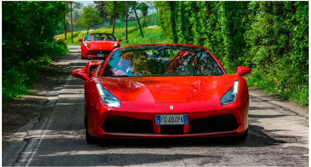
Setzen Sie sich selbst ans Steuer!

Diese besondere Reise lässt nicht nur die Herzen der Auto- und Motorsport-Fans höher schlagen. Sie reisen in das Mekka der italienischen Edelschmieden rund um Modena. Auf geführten Rundgängen durch die Werke der LuxusSportwagen-Hersteller, wie Lamborghini, der mit seinem „Miura“ die Autowelt revolutionierte, oder Pagani, der mit seinem einzigartigen Design und Sound an das Cockpit eines Düsen-Jets erinnert, werden Sie einen unmittelbaren Einblick in den Produktionsprozess erhalten. In Maranello, der Heimat des weltbekannten Sportwagenherstellers Ferrari, erhalten Sie einen Eindruck von der Größe der Produktionsstätte und erfahren mehr über die Geschichte des wohl bedeutendsten Sportwagenbauers der Welt Enzo Ferrari und seiner Automobile. Ein wahrer Genuss ist nicht nur das Automuseum Umberto Panini, sondern auch der köstliche Parmigiano Reggiano und der würzige Aceto Balsamico, die beiden berühmtesten Spezialitäten der Region. Abgerundet wird diese exklusive Reise mit einem Besuch und Besichtigung der prächtigen Stadt Bologna. Außerdem erhalten Sie die exklusive Möglichkeit sich selbst ans Steuer eines Ferraris zu setzen.