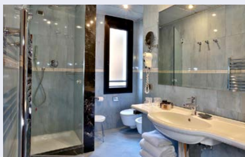
Beispiel - Badezimmer