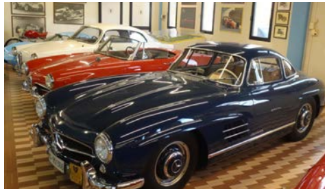
Umberto Panini Museum

im Ferrari € 140,- im Lamborghini € 200,-