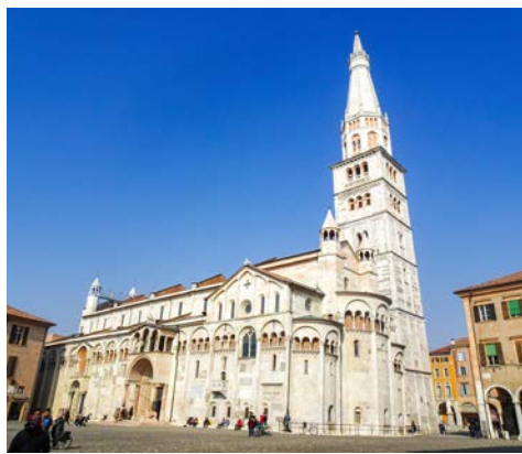
Malerische Altstadt Modena