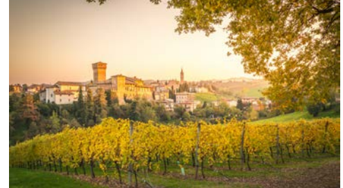
Herrliche Landschaft rund um Modena