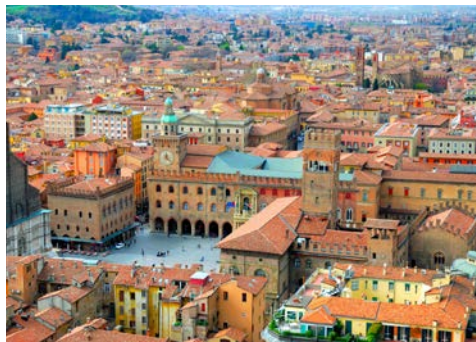
Das historische Zentrum Bolognas

aus nächster Nähe bewundern, die vom großen Enzo Ferrari persönlich gefahren wurden. Danach besteht die Möglichkeit sich selber hinter das Steuer eines Ferraris zu setzen und dessen Straßenlage zu testen. Diesen eindrucksvollen Tag beschließen Sie bei einem gemeinsamen Abendessen in Modena.