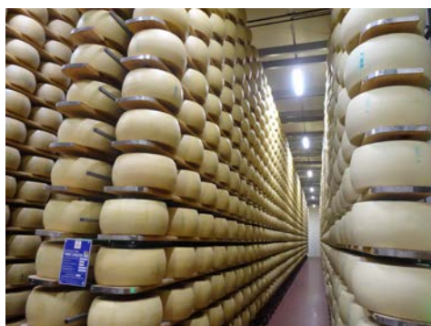
Käserei – so lagert der Parmegiano Reggiano