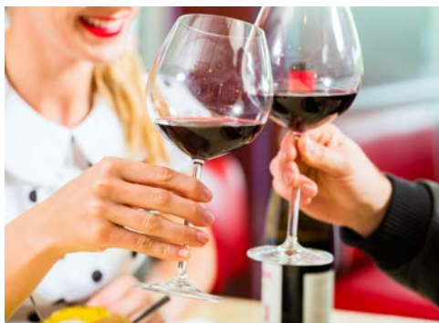
Verkosten Sie typischen Lambrusco auf einem Weingut

Dieser Tag steht ganz im Zeichen des Rennwagenherstellers Ferrari. Sie besuchen das Museum Enzo Ferrari in Modena, das dem Leben und Werk des Gründers Enzo Ferrari gewidmet ist. In Maranello, der einstigen Heimat Enzo Ferraris, angekommen erhalten Sie auf einer Rundfahrt einen Eindruck über die Größe der Produktionsstätte des weltberühmten Rennstalls. Im angrenzenden Ferrari Museum können Sie anschließend u. a. einige Ferrari-Modelle