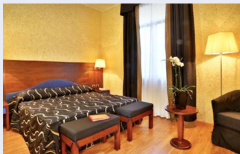
Beispiel - Doppelzimmer

Weitere Abflughäfen auf Anfrage ggf. gegen Gebühr mög- lich. Bitte beachten Sie: Für die Flüge und Bahnfahrten gilt: Umsteigeverbindungen möglich; Flüge in der Economy Class; Bahnfahrten mit Sitzplatzreservierung.