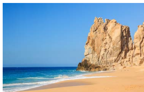
Cabo San Lucas

Zum Abschluss dieser grandiosen Reise erwartet Sie noch ein städtisches Highlight der USA: Los Angeles, Stadt der Engel, unzählige Male in allen möglichen Film- und Serienvarianten über unsere Bildschirme geflattert und heute sind Sie da! Hollywood mit dem bekannten Grauman's Chinese Theater, wo Sie die Hand- und Fußabdrücke der Filmstars bewundern können, der „Walk of Fame“, Beverly Hills ... Halten Sie Ihre Kamera bereit! Freuen Sie sich auf eine Panoramafahrt, endend am Flughafen. Rückflug nach Deutschland, Ankunft am 19. Tag.