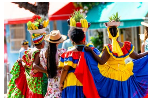
Palenqueras Frauen in Cartagena

Cartagena, eine der schönsten Kolonialstädte Südamerikas, empfängt Sie mit dem hippen Viertel Getsemani. Entdecken Sie die vielen Bars und Restaurants und die farbenfrohen Wandmalereien. Das komplett vom Festungsring ummauerte alte Stadtzentrum sowie die Kathedrale und das Viertel der kleinen Händler, San Diego, gehören seit 1984 zum UNESCO-Weltkulturerbe.