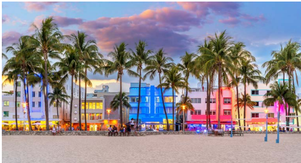
Vielleicht besuchen Sie Miami South Beach?