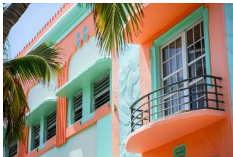
Farbenfrohe Art Deco-Häuser am Ocean Drive

Flug nach Miami, wo Sie von Ihrer Deutsch sprechenden Reiseleitung empfangen werden. Sammeln Sie bereits auf Ihrem Transfer zum Hotel erste Eindrücke dieser pulsierenden Metropole. Übernachtung im Hotel.