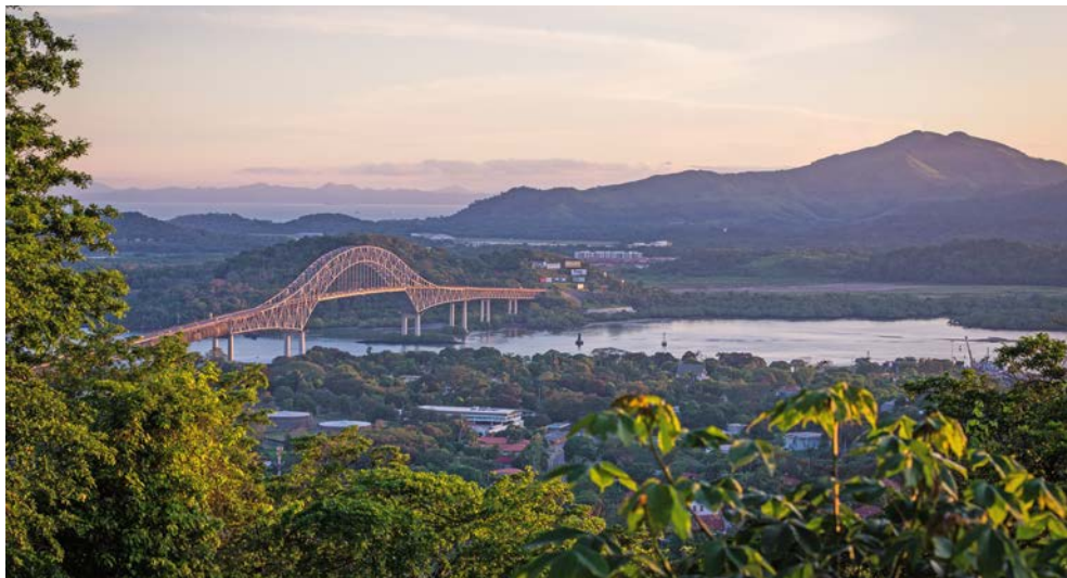
Freuen Sie sich auf den Panamakanal