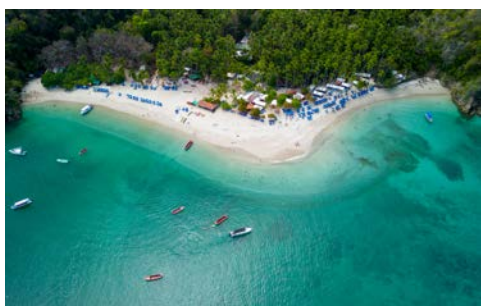
Tortuga Island in Puntarenas

Costa Rica ist ein Paradies für Naturliebhaber. Entdecken Sie die nebelverhüllten Vulkane und die üppigen Wälder. Im Tal der Affen können Sie die atemberaubende Natur mit 100 Jahre alten Bäumen, Orchideen, verschiedenste Arten von Schmetterlingen, Vögel und Affen erleben.