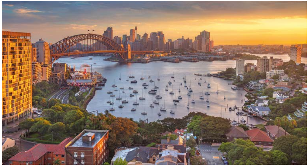
Blick auf Sydney

Diese Reise entführt Sie an das andere Ende der Welt. Den Auftakt bildet Australien: Sie erleben Sydney bei einer Stadtrundfahrt mit Hafensrundfahrt und Besichtigung der berühmten Sydney Oper. Die NOORDAM bringt Sie im Anschluss nach Neuseeland. Dieses Stückchen Erde gilt als das letzte Land, das je von Menschen besiedelt wurde. Das Gefühl, sich an einem jungen, unverfälschten Ort zu befinden, spürt man überall: ob die unberührten Landschaften, die noch ausgeprägte, einzigartige Flora und Fauna oder die unkomplizierte Lebensart der „Kiwis“, wie sich die Einwohner gerne analog zu ihrem Nationalsymbol nennen. Hier in Neuseeland erlebt man noch wahre Ursprünglichkeit. Eine Besichtigungstour in Auckland rundet Ihre Reise perfekt ab.