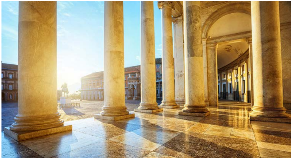
Neapel – Piazza del Plebiscito

Fahrt im malerischen Hafen von Marina Grande anlegt. Über die steil ansteigende Serpentinstraße erreichen Sie Anacapri. Durch die Ausführungen Ihres Reiseleiters erhalten Sie einen ersten Eindruck von den Besonderheiten der Villa San Michele, die einst vom schwedischen Arzt und Schriftsteller Axel Munthe bewohnt wurde. Heute befindet sich ein Museum im Haus, das viele interessante Artefakte und Kunstwerke beherbergt. Per Bus geht es weiter nach Capri-Dorf. Zunächst führt hier ein kurzer Spaziergang an der dortigen Piazzetta entlang. Von den Augustusgärten aus genießen Sie einen herrlichen Blick auf die bekannten Faraglioni Felsen. Im Anschluss bleibt genug Zeit, um je nach Wunsch eine Kleinigkeit zu essen oder individuell den charmanten Ort mit seinen kleinen Gassen und Cafés zu durchstreifen. Am Nachmittag verlassen Sie das malerische Capri und kehren mit dem Schnellboot aufs Festland zurück. Am Hafen von Sorrent stehen Kleinbusse für den Transfer ins Hotel bereit.