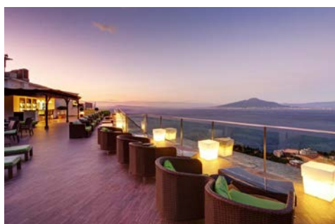
Herrlicher Ausblick von der Dachterrasse Ihres Hotels