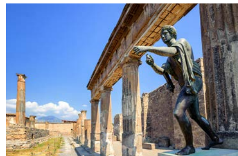
Pompeji – ein Muss für jeden!

Das erste Ziel des heutigen Ausflugstages sind die Ausgrabungen von Pompeji. Auf einem Rundgang unternehmen Sie einen Ausflug in die Antike. Sie erkunden das legendäre Pompeji, jene Stadt, die 79 v. Chr. bei einem Ausbruch des Vesuvs verschüttet und durch meterhohe Ascheberge konserviert wurde. Pompeji ist das großartigste Beispiel einer durch Ausgrabung wieder zugänglich gemachten altrömischen Stadt und ihrer Wohnkultur. Erstaunlich gut erhalten und auch modern mutet die Architektur der Bäder, Theater, Luxus- und Bürgerhäuser dieser antiken Stadt an. Im Anschluss fahren Sie auf ein am Fuße des Vesuvs gelegenes Wein- gut, die Cantina del Vesuvio. Bei einem Rundgang über das Gelände mit Weinbergen und Weinkeller erfahren Sie viel Wissenswertes. Seit 1996 arbeitet die Cantina del Vesuvio mit biologischen Anbaumethoden. Die sandigen Vulkanböden werden nur mit organischen Düngemitteln gedüngt und die Trauben auf natürliche Weise mit Kupfer und Schwefel behandelt. Cantina del Vesuvio ist unter der Marke BIO bio-zertifiziert und die Bio-Weine entsprechen den strengsten europäischen Vorschriften. Freuen Sie sich auf eine schmackhaftere Verköstigung von lokalen Produkten im Schatten des Vesuvs. Dazu werden verschiedene Weiß- und Rotweine, Spumante und Aprikosenschnaps gereicht. Rückfahrt zum Hotel und Abendessen.