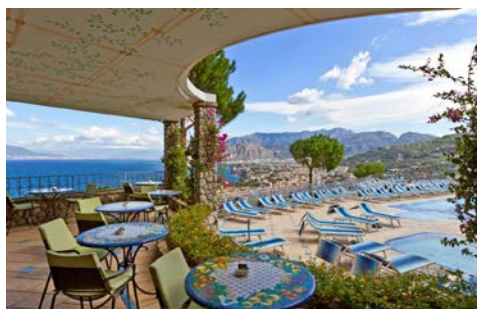
An der Poolbar

zurück (alternativ ca. 20 Minuten Fußweg). Dieser startet und endet direkt vor dem Hotel. Zum Entspannen steht Ihnen der Swimmingpool mit Sonnenliegen zur Verfügung. Dieser ist i.d.R. von April bis Oktober geöffnet. Daneben können Sie den Spa-Bereich kostenpflichtig nutzen. Italienisch und international inspirierte Gerichte serviert Ihnen das Restaurantpersonal in einer idyllischen Atmosphäre mit Aussicht über die Bucht. Nach dem Essen verweilen Sie bei einem Getränk an der Loungebar. Elegant und einladend, im klassischen Stil und mit warmen Farben gestaltet, verfügen alle 110 Zimmer über Balkon oder Terrasse, über Free Wi-Fi, Direktwahltelefon, zentrale Klimaanlage, Minibar, Satelliten-TV mit Sky-Kanälen, elektronischen Safe, Haartrockner und WC mit Dusche oder Badewanne. Hinweis: Zimmer ohne Meerblick können in den unteren Etagen des Hotels mit Blick zum Hang liegen.