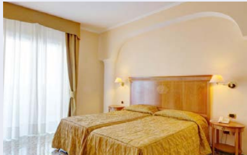
4-Sterne Grand Hotel President – Zimmerbeispiel

Genießen Sie eine atemberaubende Aussicht über Sorrent und den Golf von Neapel im Grand Hotel President (Landeskategorie: 4 Sterne). Dank seiner erhöhten Lage besticht das Hotel durch eben diese fantastische Aussicht sowie durch seine üppigen, mediterranen Gärten. Ihr Hotel liegt am Ende einer ruhigen, ebenen Privatstraße. Ihr Bus für die Ausflüge ist nur fußläufig (ca. 400 Meter) erreichbar. Der Shuttlebus des Hotels verkehrt mehrmals täglich ins Zentrum und