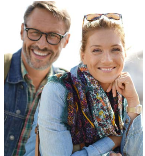
Genießen Sie die abwechslungsreiche Zeit