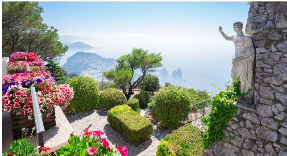
Capri – traumhafte Aussichten von den Augustusgärten

06.10.-13.10.2025 13.10.-20.10.2025 20.10.-27.10.2025 27.10.-03.11.2025 03.11.-10.11.2025