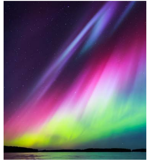
Mit etwas Glück sehen Sie Polarlichter