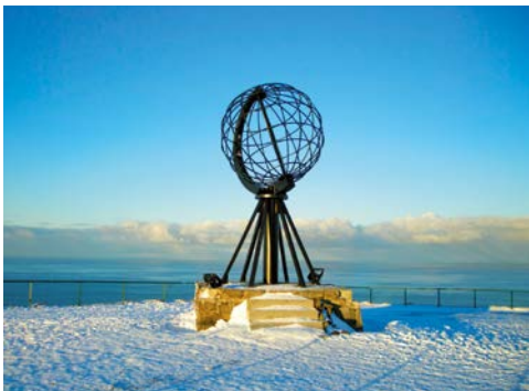
Das Nordkap bietet grandiose Ausblicke Richtung Arktis

Am Morgen erreicht die OTTO SVERDRUP die kleine Stadt Honningsvåg. Nicht entgehen lassen sollten Sie sich einen Abstecher zum Nordkap – dem nördlichsten Punkt Europas.