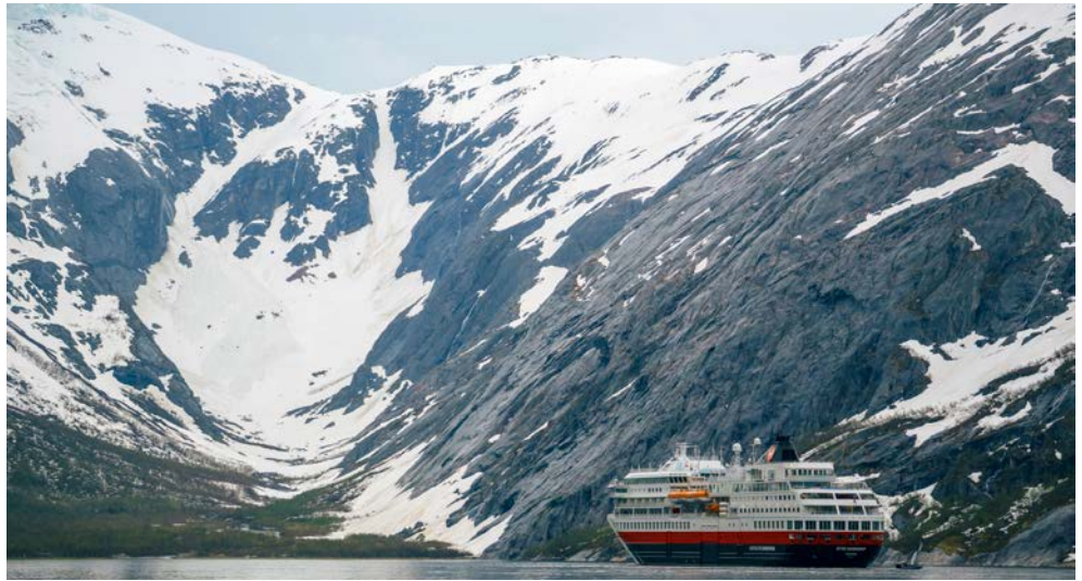
Spektakuläre Panoramen erwarten Sie

Diese zweiwöchige Hurtigruten Reise auf der OTTO SVERDRUP startet in Hamburg und führt Sie entlang der norwegischen Küste mit fachkundiger Begleitung eines Expertenteams. Das hochmoderne Schiff besticht durch eine neue, umweltschonende und nachhaltige Hybrid Technologie. Mit seinem deutlich reduzierten Kraftstoffverbrauch zeigt es der Welt, dass Hybridantriebe bei großen Schiffen möglich sind. Entdecken Sie abseits vielbefahrener Strecken die Schönheit abgelegener Fjorde inmitten spektakulärer Landschaften. Sie fahren über den nördlichen Polarkreis hinaus in die Polarlichtzone – Nordlicht-Versprechen inklusive. Unterwegs erleben Sie malerische Häfen, wunderschöne Fjorde, Gletscher, einzigartige Bergkulissen und raue landschaftliche Schönheiten bis hin zum Nordkap. Um diese Jahreszeit ist die Wahrscheinlichkeit sehr hoch, die spektakulären Nordlichter zu sehen – auch mehrfach!