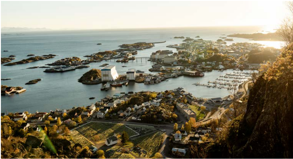
Welch fantastische Kulisse – herbstliches Svolvær auf den Lofoten