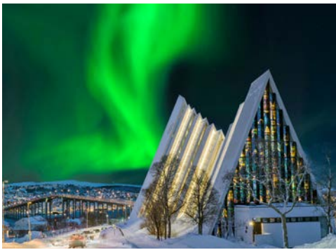
Die Eismeerkathedrale in Tromsø

Arktis war. Wenn Sie mehr darüber erfahren möchten, gehen Sie ins Polar Museum: Hier zeigt man Ausstellungen über norwegische Polarexpeditionen und Fangtraditionen sowie Sonderausstellungen über Eisbären und das Forschungstreiben von Fridtjof Nansen und Roald Amundsen. Sie sollten auch unbedingt die moderne Eismeerkathedrale besuchen, die durch ihr riesiges Buntglasfenster beeindruckt.