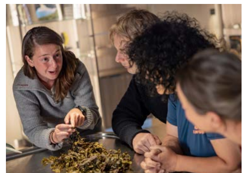
Im Science-Center an Bord