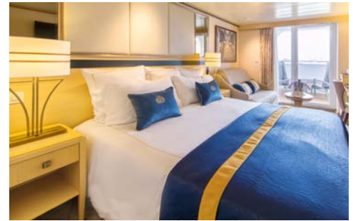
Balkonkabine – Beispiel

Programmänderungen vorbehalten. An- und Abreisetage dienen ausschließlich der Erbringung der vertraglichen Beförderungsleistungen. Stand 10/24 – alle Angaben ohne Gewähr.