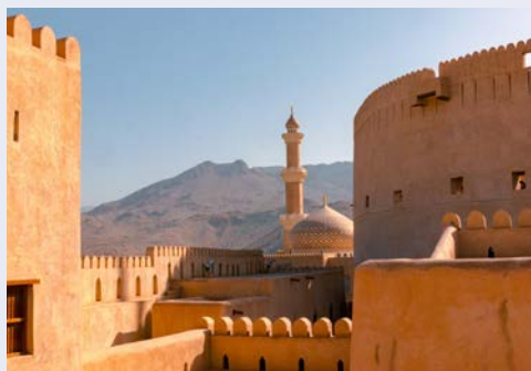
Das Fort in Nizwa