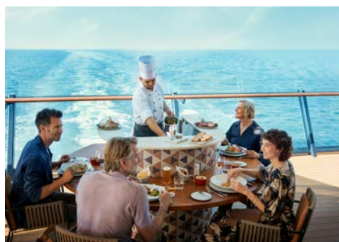
Herzlich willkommen an Bord