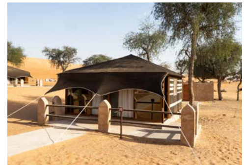
Eine Nacht im Wüstencamp

Heute geht die Fahrt durch das Oasendorf Birkat Al Mauz, mit dem unter UNESCO Schutz stehenden alten Bewässerungssystem und alten Lehmhäusern, bis zur Oasenstadt Bahla, eine der ältesten Königstädte des Omans. Sie ist Zentrum der Töpferkunst und von einer 12 km langen und 5 m hohen Stadtmauer aus Lehm umgeben. Weiter geht es zum Fort von Jabrin. Es ist eines der am besten erhaltenen Forts und wurde mit viel Liebe zum Detail in den letzten Jahren grundlegend renoviert. Am Abend erreichen Sie Nizwa. Übernachtung.