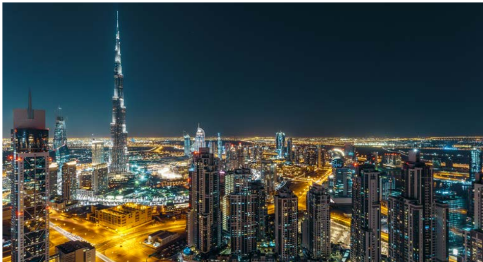
Das höchste Gebäude der Welt: der Burj Khalifa mit 828 m

Luxusläden, ultramoderne Architektur und ein pulsierendes Nachtleben bekannt. Transfer zum Hafen und Einschiffung auf die Mein Schiff 2 . Der zweite Teil Ihrer Reise beginnt! Übernachtung an Bord in Dubai.