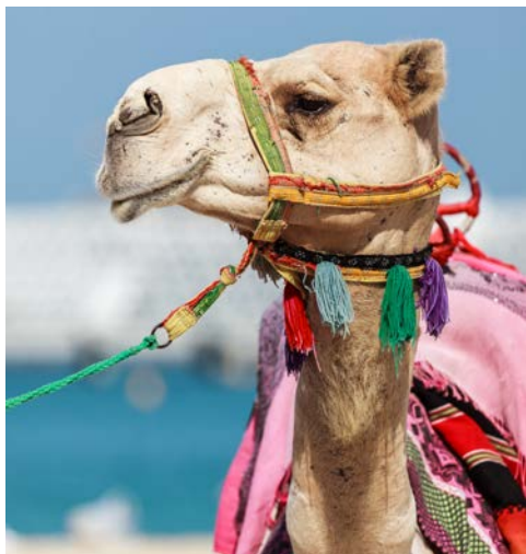
Noch immer Bestandteil der emiratischen Kultur – Kamele

Unfassbar hohe Gebäude, Hotels mit sieben Sternen und die teuersten Autos der Welt – ganz klar, Dubai ist als Ort der Superlative bekannt. Bei all dem Überfluss gerät die Vergangenheit schnell in Vergessenheit. Vollkommen zu unrecht, denn die ist besonders schön. Besuchen Sie die historische Altstadt mit ihren engen Gassen und traditionellen Händlern oder informieren Sie sich auf dem Kamelmarkt über die aktuellen Preise für wüstentaugliche Reittiere. Wo Sie sich in Dubai auch aufhalten, das Beste von gestern und morgen wird Sie mit Sicherheit verzaubern.