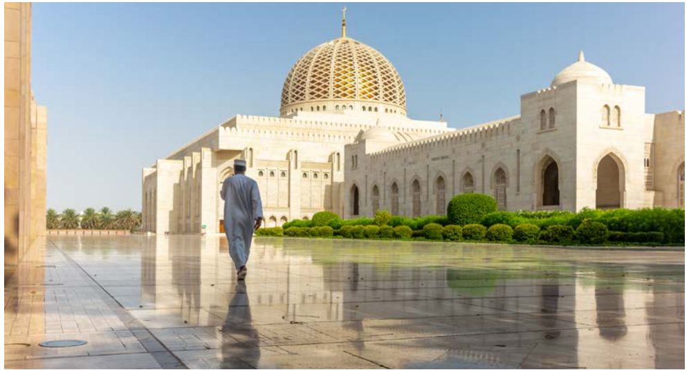
Die Große Moschee in Maskat