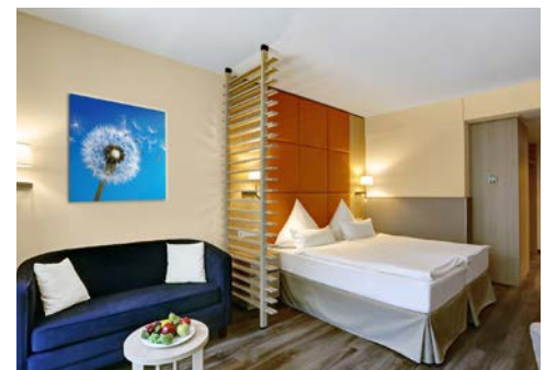
Einzel-/Doppelzimmer de Luxe