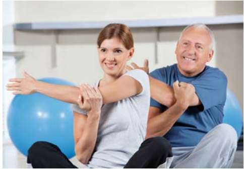
Rückengymnastik beugt vor und lindert Schmerzen