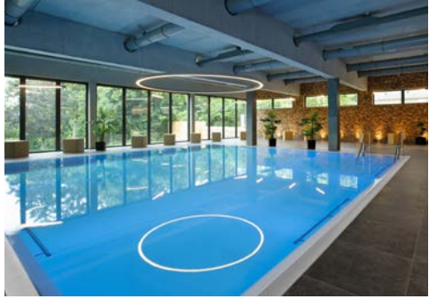
Das neue Solebad mit 34°C warmem Wasser

Das Schwimmbad mit 20 m Sportbecken können Sie außerhalb der Kurszeiten nutzen. Erleben Sie Wellness pur beim Bad in der 33°C warmen VITAL-Quelle mit Sprudelliegen und Massagedüsen.