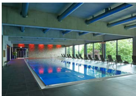
Schwimmbad mit 20 m Sportbecken

Zur Ausstattung des 3.800 m 2 großen SPA & Sportbereichs zählen eine Saunalandschaft mit Salzsau-na, finnischer Sauna (90°C) und 60°C-Sauna sowie großzügigem Ruhebereich und Außenfläche. Separat wird eine Damensau-na (60°C und 90°C) mit eigenem Ruhebereich geboten.