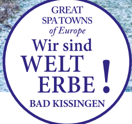
Bad Kissingen ist auch im Winter unbedingt eine Reise wert!