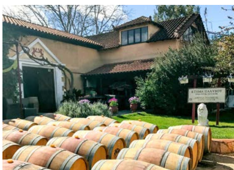
Sie besuchen auch ein Weingut

Nach dem Frühstück Abfahrt nach Alt Korinth. Wegen der Lage zwischen dem griechischen Festland und dem Peloponnes entwickelte sich Korinth seit mykenischer Zeit zu einem blühenden Handelszentrum. Vor dem Hintergrund des mächtigen Bergklotzes von Alt Korinth liegen die Reste dieser antiken Stadt, die einst vermutlich gut 300.000 Einwohner zählte und einen Verkehrsknotenpunkt zwischen Asien und Europa darstellte. Nach dem Besuch der Ausgrabung Weiterfahrt zum Kanal von Korinth. Genießen Sie einen Blick in 75 Meter Tiefe. Der Kanal von Korinth ist ca. 7 km lang, ca. 23 Meter breit und wurde zwischen 1881 bis 1893 gebaut. Anschließend geht es in eines der bekanntesten Weinanbaugebiete der Peloponnes, nach Nemea. Es erwartet Sie eine Weinprobe bei einem der Winzer der Region. Sie besuchen ein familiengeführtes Weingut und haben die Gelegenheit, einige der Weine der Region zu probieren. Anschließend Rückfahrt zum Hotel und den Nachmittag zur freien Verfügung (ca. 95 km).