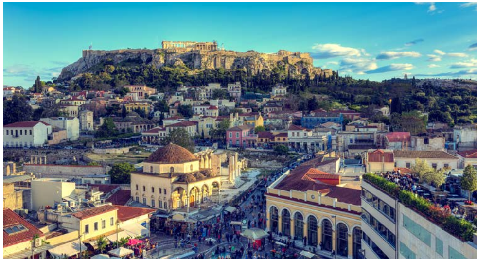
Die Akropolis thront oberhalb von Athen

Der Peloponnes gehört zweifellos zu den schönsten und abwechslungsreichsten Landschaften Griechenlands: lange, mit Dünen gesäumten Sandstrände an der Westküste, aufragende Gebirgszüge, bilderbuchschöne Aussichten über Schluchten und verträumte Meeresbuchten, traditionelle Dörfer und alte Klöster. Berühmte Ausgrabungsstätten wie Epidaurus und Mykene, römische Thermen, antike Museen, oder Klöster mit kunstvollen Fresken. Auch geschichtlich ist die Region einzigartig. Ein Tagesausflug führt, wenn Sie mögen, nach Athen, wo die Akropolis und die Plaka besucht werden. Über 2.000 Jahre alte Kulturen und beeindruckende Ausgrabungsstätten. Wenn Sie die Ausflüge gebucht haben, erkunden Sie, bequem, ohne lästiges Kofferpacken, eine der abwechslungsreichsten Gegenden Griechenlands. Genießen Sie typische Spezialitäten und tauchen Sie ein in die lebendige Geschichte der Götter- und Heldensagen!