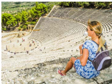
Amphitheater in Epidaurus

Nach der Ankunft am Flughafen von Athen erfolgt der Transfer zum Hotel bei Vrachati (ca. 130 km).