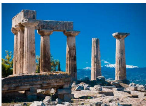
Ausgrabungen in Alt Korinth

Heute erfolgen der Transfer zum Flughafen und der Rückflug zum gebuchten Flughafen in Deutschland. (ca. 130 km)