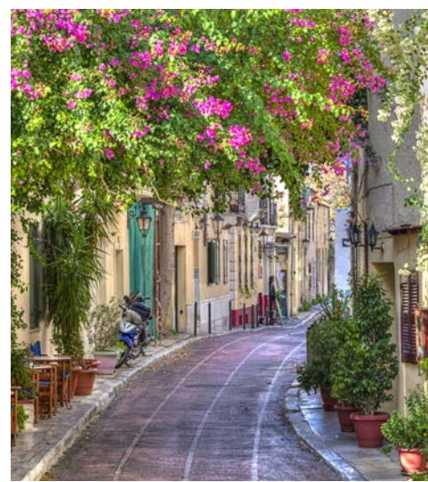
In der Plaka (Altstadt) von Athen

Heute geht es in die Landeshauptstadt. Sie beginnen zunächst mit einer Stadtrundfahrt in Athen. Vorbei am Zeustempel, dem königlichen Palast, dem Parla-ment und dem Syntagma-Platz fahren Sie zur Akro-polis, von wo Sie einen wunderbaren Blick über Athen haben. Freizeit mit Gelegenheit zum Mittagessen in der Plaka. Anschließend Spaziergang durch die Alt-stadt zum Akropolismuseum (ca. 230 km). Nach der Besichtigung Rückfahrt ins Hotel.