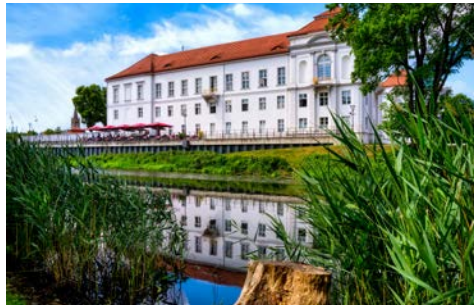
Barockschloss in Oranienburg

Nach der Einschiffung auf die PRINCESS haben Sie noch Zeit für einen Bummel über den Kurfürstendamm oder einen Blick durchs Brandenburger Tor.