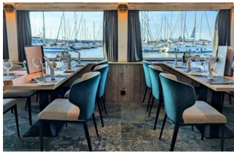
Willkommen im neu gestalteten Restaurant an Bord