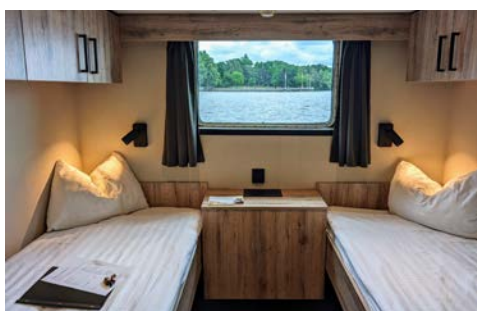
Kabinenbeispiel auf dem Hauptdeck