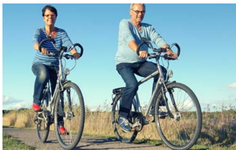
Mit netten Mitreisenden unterwegs

Einen Besuch der nahe gelegenen Stadt Putbus (ca. 2 km) mit ihrem bekannten „Circus“ sollten Sie nicht verpassen. Klassizistische Gebäude säumen diesen