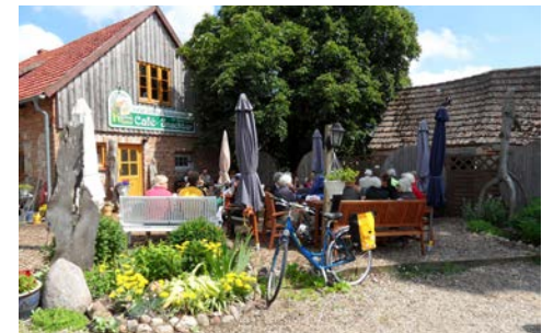
Eine kurze Pause zwischendurch

Schiffsfahrt Mescherin – Stettin/Polen Heute fahren Sie über den Oder-Neiße-Radweg durch einen Teil des einzigartigen grenzüberschreitenden Schutzgebiets „Internationalpark Unteres Oder-tal“. Der ehemalige Gutshof Criewen beherbergt das Nationalparkzentrum des einzigen Auennationalparks Deutschlands. In Mescherin angekommen, gehen Sie wieder an Bord und genießen die Schiffsfahrt nach Stettin. Sie gilt als „die grüne Großstadt an der Odermündung“ und ist einer der größten Häfen an der Ostsee. Sehenswert: Das in der Altstadt liegende Schloss der Herzöge von Pommern.