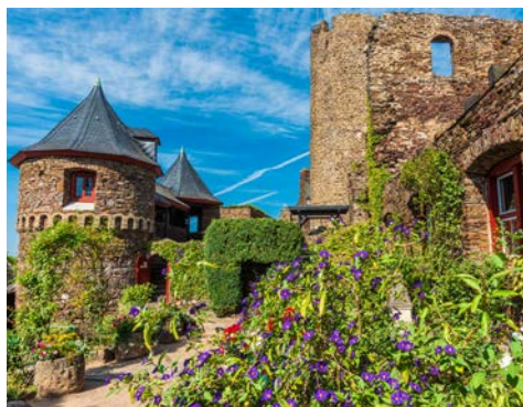
Burg Thurant, oberhalb von Alken