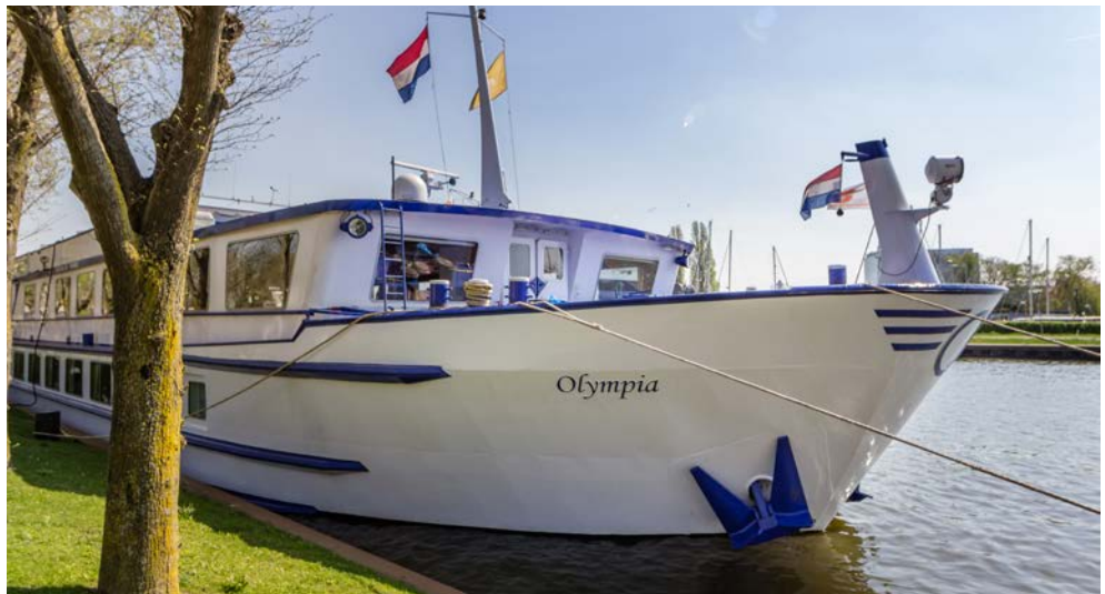
Ihr Schiff – die OLYMPIA