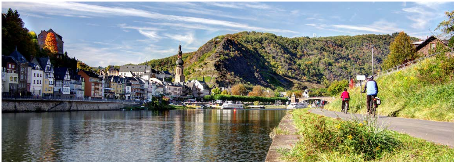
Fantastische Aussichten am Moselradweg bei Cochem