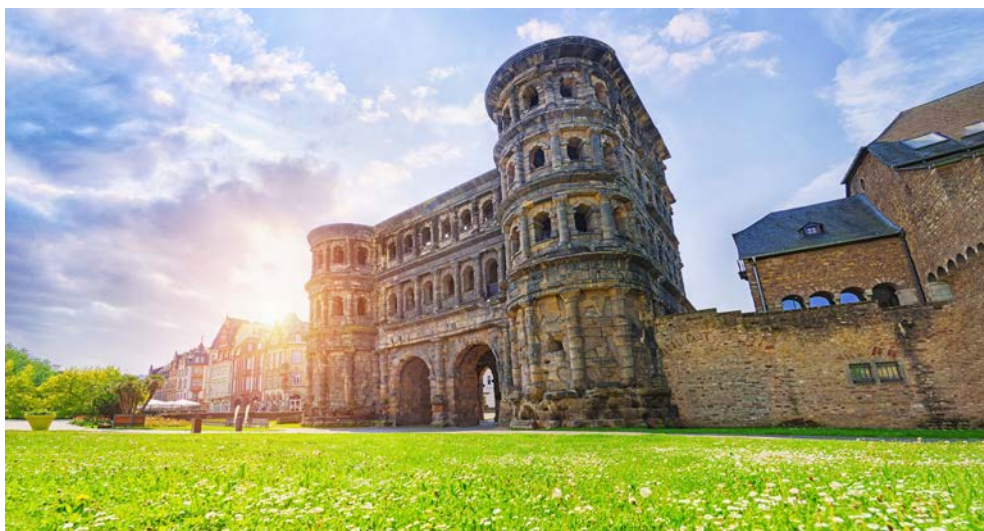
Imposant - die Porta Nigra in Trier