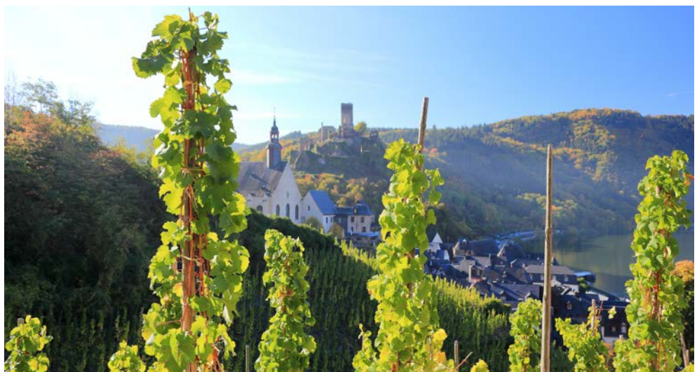
Blick durch Weinstöcke nach Beilstein

Heute fahren Sie mit dem Rad zuerst durch das romantische Traben-Trarbach, die Stadt des Jugendstils an der Mittelmosel, und anschließend durch den weltbekannten Weinort Kröv bis nach Bernkastel-Kues. Hier säumen stattliche Fachwerkhäuser den mittelalterlichen Marktplatz, der zum Müßiggang einlädt.