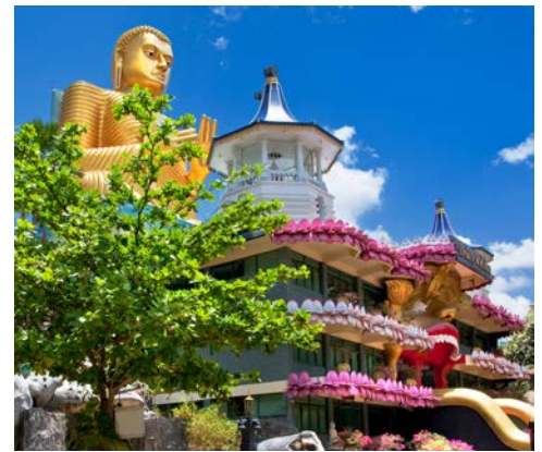
Höhletempel von Dambulla

1. und 2. Tag: Anreise – Colombo/Sri Lanka Flug nach Sri Lanka. Ankunft in Colombo am Morgen des 2. Tages. Erste Eindrücke gewinnen Sie bei einer Rundfahrt durch die quirlige und vielfältige Inselhauptstadt. Sie sehen den 100 Jahre alten britischen Uhrturm, alte Prachtbauten aus der britischen Kolonialzeit, moderne weltstädtische Architektur und immer wieder auch buddhistische Tempel, von denen der Gangarama Tempel einer der bedeutendsten des Landes ist. Eine Nacht im Hotel Ramada Colombo (Landeskategorie: 4 Sterne). (A)