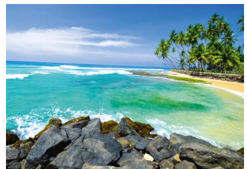
Traumstrände auf Sri Lanka