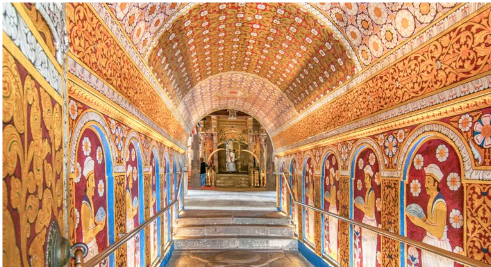
Zahntempel in Kandy