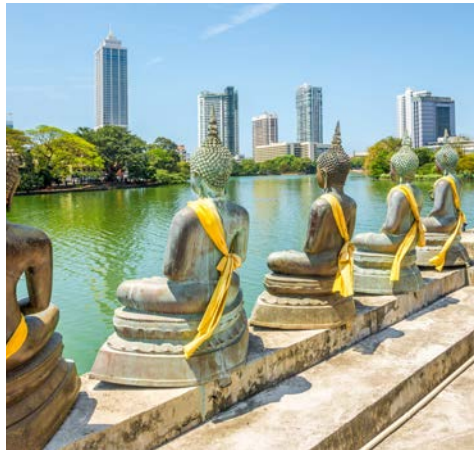
Gangarama Tempel mit Blick auf den Beira See und Colombo

Heute geht es in die alte Hauptstadt Anuradhapura (UNESCO-Weltkulturerbe), einstiges Zentrum der singhalesischen Königsdynastien, die auch den ältesten buddhistischen Tempel der Insel beherbergt. Der Tempel für den Heiligen Bodhi-Baum ist eine der heiligsten Stätten der Insel. Mit etwas über 2.200 Jahren gilt er als einer der ältesten Bäume der Erde. Er soll ein Ableger des Baumes sein, unter dem Buddha seine Erleuchtung fand. Eindrucksvoll ist auch der Besuch des Klosters Mihintale, das als die Geburtsstätte des Buddhismus auf Sri Lanka gilt und Ziel ist von Tausenden von Pilgern. (F, A)