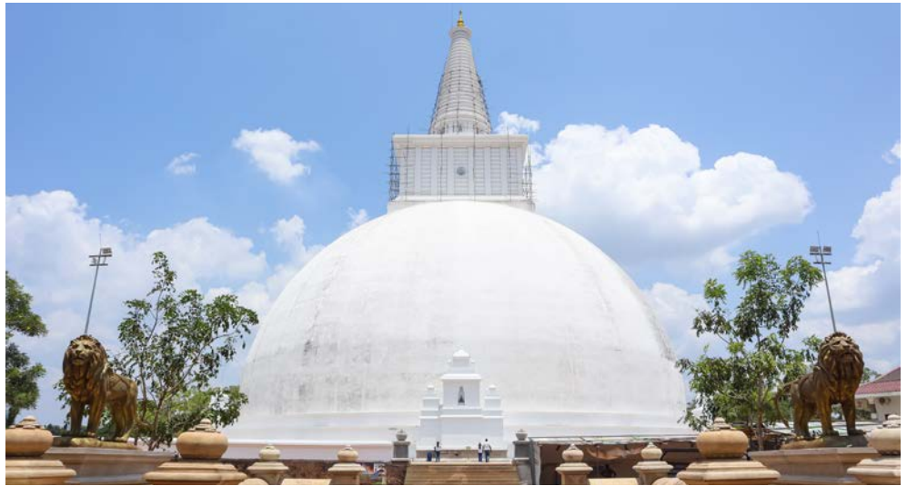
Die größte Stupa Sri Lankas in Anuradhapura

Die Insel im Süden des indischen Subkontinents ist ein tropisches Paradies, in dem es nach Tee und Gewürzen riecht! Erleben Sie die Vielfalt des Landes: beeindruckende Tempelanlagen, die die tiefe Gläubigkeit der Bevölkerung widerspiegeln, tropische Nationalparks, die Sie mit dem Jeep erkunden und palmengesäumte lange Sandstrände. Ein entspannter Strandaufenthalt an der traumhaften Küste von Beruwela rundet die Reise perfekt ab! Bilderbuchschöne Ansichten, magische Momente und einzigartige Naturschauspiele – erleben Sie den Zauber Asiens!