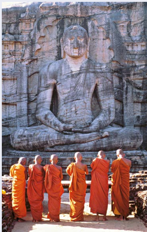
Felstempel in Polonnaruwa