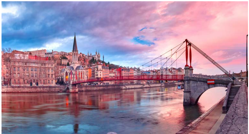
Zauberhafte Impressionen erwarten Sie in Lyon