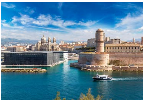
Der alte Hafen von Marseille

Der heutige Tag steht Ihnen zur freien Verfügung. Schlendern Sie durch die wunderschöne Altstadt von Avignon und lassen Sie die Seele auf einem der vielen schönen Plätze baumeln. Wenn Sie möchten, können Sie entweder am Ausflug nach Marseille oder Aix-en-Provence teilnehmen (Bitte bei Reiseanmeldung buchen für eine bessere Planung der Ausflüge). Marseille ist die zweitgrößte französische Stadt nach Paris. Die Griechen gründeten hier ihren wichtigsten Umschlag- und Handelsplatz für Europa und erschlossen wichtige Handelsrouten. Heute ist Marseille Frankreichs bedeutendste Hafenstadt. Bei Ihrem Rundgang sehen Sie den alten Hafen, das Rathaus und das alte Viertel „Le Panier“. In diesem Viertel lag der ursprüngliche Stadtkern und auch die griechische Siedlung des antiken Massalia. Enge Gassen und schöne Plätze laden zum Bummeln ein. Aix-en-Provence, kurz auch „Aix“, zählt für die Franzosen zu den Städten mit der höchsten Lebensqualität. „Die Stadt der Brunnen“ und historische Hauptstadt der Provence war auch die Heimat von Paul Cézanne, welcher hier viele Bilder gemalt hat. In Aix-en-Provence führt Sie Ihr örtlicher Guide durch die Stadt bis zur Kathedrale Saint-Sauveur.