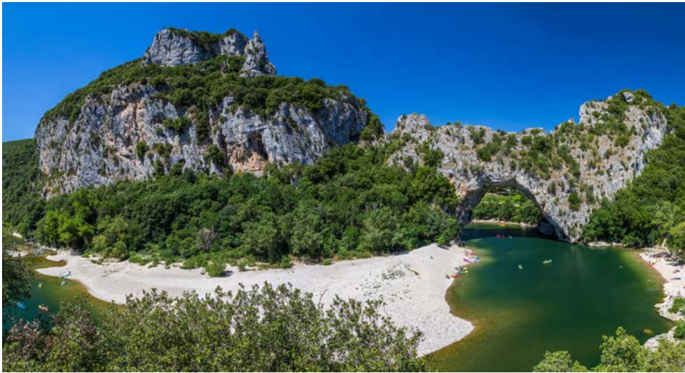
Grandiose Natur an der Ardèche

Touristen. Nach Ihrem Aufenthalt bringt Sie der Bus zurück zum Schiff in Avignon.