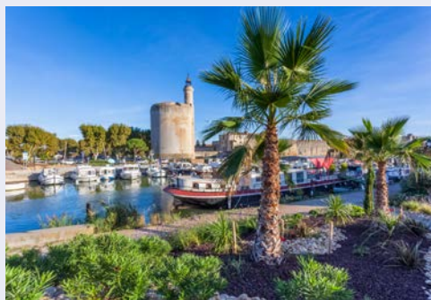
Malerisches Aigues Mortes