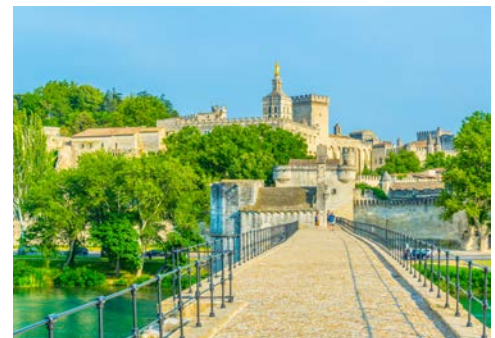
Blick auf den Papstpalast in Avignon

Nachdem Sie das Frühstück an Bord genossen haben, beginnt um 09.00 Uhr Ihr Stadtrundgang in Avignon. Mit seiner berühmten und prächtigen Altstadt zählt Avignon seit 1995 als UNESCO-Weltkulturerbe. Eine 4,5 km lange Stadtmauer umgibt noch heute das gesamte historische Zentrum. Den Höhepunkt bildet dabei eine Führung im weltberühmten Papstpalast, das Zentrum der Christenheit im 14. Jhd. und eines der wichtigsten Bauwerke der Gotik. Nach diesem interessanten Rundgang erwartet Sie das Mittagessen an Bord.