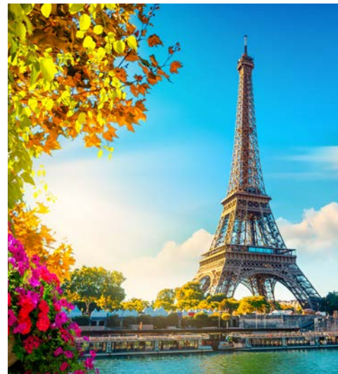
An ihm kommen Sie in Paris nicht vorbei – der Eiffelturm