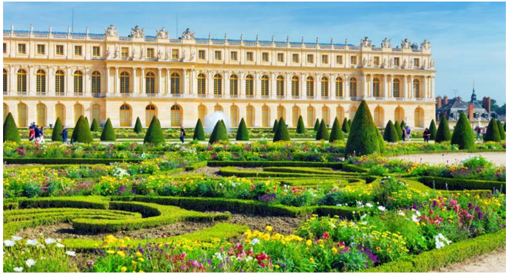
Schloss Versailles und die dazugehörigen Parkanlagen sind fantastisch!

Nach dem Frühstück an Bord beginnt ein Ausflug zum Schloss Versailles, das als das schönste und vollständigste Beispiel der französischen Kunst des 17. Jahrhunderts gilt. Entdecken Sie das prächtige „Schloss des Sonnenkönigs“, welches ursprünglich als Jagdschloss für König Ludwig XIII. gebaut wurde. Bei der Führung durch die zahlreichen Korridore, Hallen, Kabinette und Säle sehen Sie neben dem wohl berühmtesten Raum des Schlosses, dem Spiegelsaal, auch die Kapelle und die königlichen Gemächer,