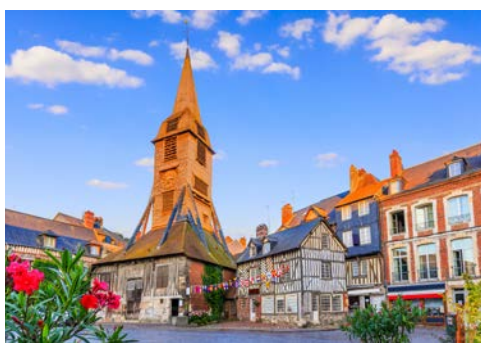
Auch der Küstenort Honfleur ist bezaubernd

seine steilen Felsenklippen und beeindruckenden Felsformationen. Die Stadt, die pittoresk an hohen Kreidefelsen gelegen ist, zählt zu den schönsten Orten an der Alabasterküste. Zahlreiche Maler wie Monet, Courbet und Isabey, Schriftsteller und der Komponisten Offenbach fanden hier Inspiration. Lassen Sie sich von diesem einzigartigen Flair ebenfalls bezaubern und genießen Sie die raue Natur. Anschließend geht es mit dem Bus weiter nach Honfleur. Auf der Fahrt haben Sie Gelegenheit, das vom Küchenteam der VIVA GLORIA zusammengestellte Lunchpaket zu verzehren. Der malerische Ort liegt an der Mündung der Seine zum Ärmelkanal und blickt auf eine lange Vergangenheit zurück. Das historische Hafenbecken, die malerischen Gassen und die traditionellen Fachwerkhäuser machen den kleinen Seefahrer- und Künstlerort zu einem der entzückendsten Küstenstädtchen der Normandie. Im Herzen des alten Seemannsviertels befindet sich ein einzigartiges Bauwerk: die Kirche Sainte-Catherine aus dem 15. – 16. Jhd. Sie ist die größte Holzkirche Frankreichs mit separatem Glockenturm. Um 18.30 Uhr verlässt die VIVA GLORIA Caudebec-en-Caux und begibt sich auf den Weg nach Vernon.