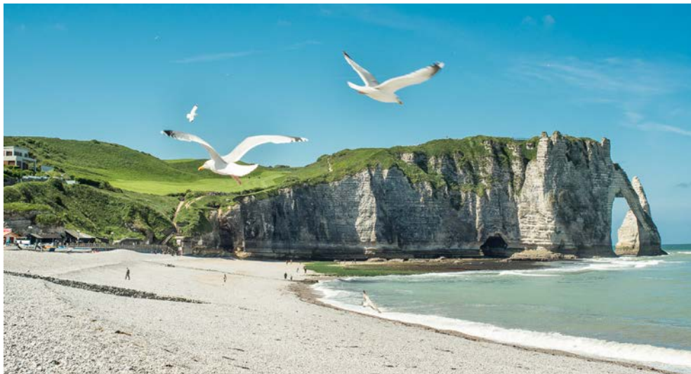
Traumhafte Ausblicke in Étretat