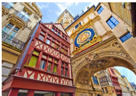
Uhrengasse in Rouen

Da das Schiff über Nacht in Rouen liegt, haben Sie die Möglichkeit, nach dem Abendessen die magische Lichtershow an der Außenfassade der Kathedrale zu bestaunen. Nicht nur für Touristen, auch für die Einwohner Rouens selbst ist dieses Spektakel, das jedes Jahr im Sommer stattfindet, inzwischen