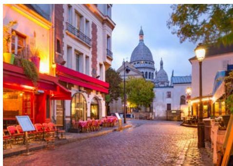
Charmant – Montmartre

Nach dem Frühstück an Bord beginnt eine faszinierende Stadtrundfahrt durch die Weltmetropole und Hauptstadt Frankreichs. Die Tour führt Sie zu den bedeutendsten Attraktionen der Stadt, darunter der ikonische Eiffelturm, der majestätische Triumphbogen, die historische Kathedrale Notre-Dame und die weltberühmten Champs-Élysées. Die Uferpromenade der Seine, die seit 1991 zum UNESCO-Weltkulturerbe zählt, wird ebenfalls Teil Ihrer Erkundung sein. Genießen Sie einen ruhigen Spaziergang durch den wunderschönen Parc du Luxembourg, einem friedlichen Rückzugsort inmitten der hektischen Großstadt.