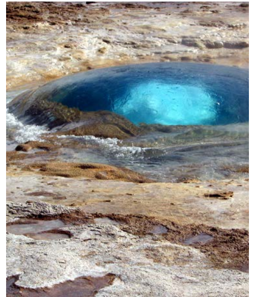
... kurz vor dem Ausbruch

eigenes Bild von den Naturschönheiten machen können. Dyrhólaey ist ein Vogelschutzgebiet. Hier haben tausende von Vögeln ihre Nistplätze. In der Brutzeit und bei schlechten Straßen- und Wetterverhältnissen besuchen wir alternativ den Küstenabschnitt Reynisfjara.