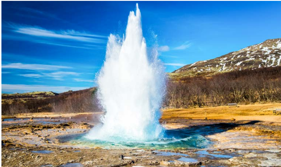
Die Springquelle Strokkur