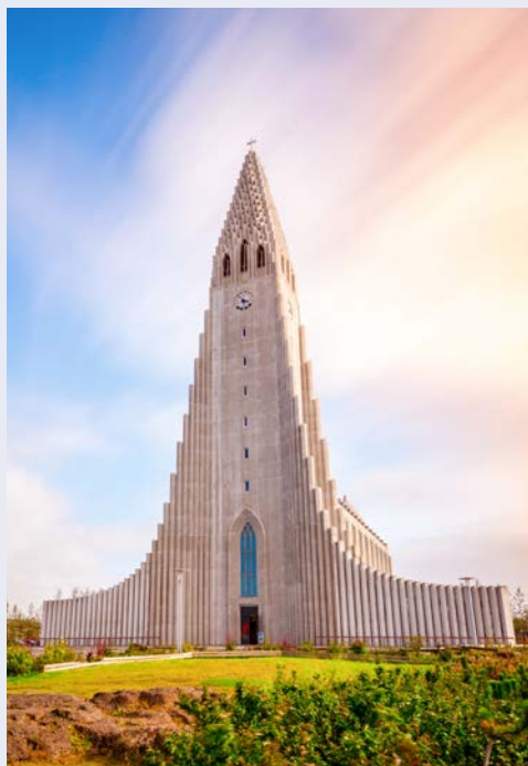
Hallgrímskirkja in Reykjavik