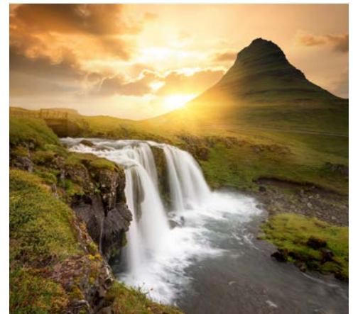
„Island en miniature“

historisch und geologisch hochinteressant ist. Hier wurde das Zusammenleben der Isländer geregelt, wurden Gesetze beschlossen und Gericht (Þing) gehalten. Zuletzt wurde hier 1944 die Republik Island ausgerufen. An der Spalte Almannagjá ist gut zu beobachten, wie sich die eurasische und die amerikanische Kontinentalplatte bisher auseinander bewegt haben.