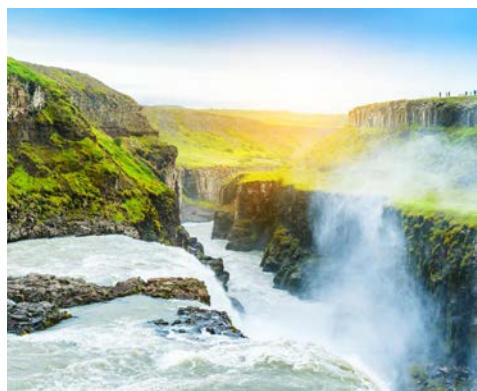
Beeindrucken – der Wasserfall Gullfoss

Das erste Ziel ist das bekannte Geysirgebiet im Tal Haukadalur, wo der „Geysir“, der Namensgeber aller Springquellen der Welt, zwar meist ruht, aber die kleinere Springquelle Strokkur schießt regelmäßig heiße Wasserfontänen in den Himmel. In der Nähe befindet sich der Wasserfall Gullfoss, auch „der goldene Wasserfall“ genannt, der stufenförmig in die Schlucht des Flusses Hvítá hinabstürzt. Die Rückfahrt erfolgt durch den Nationalpark Þingvellir, der