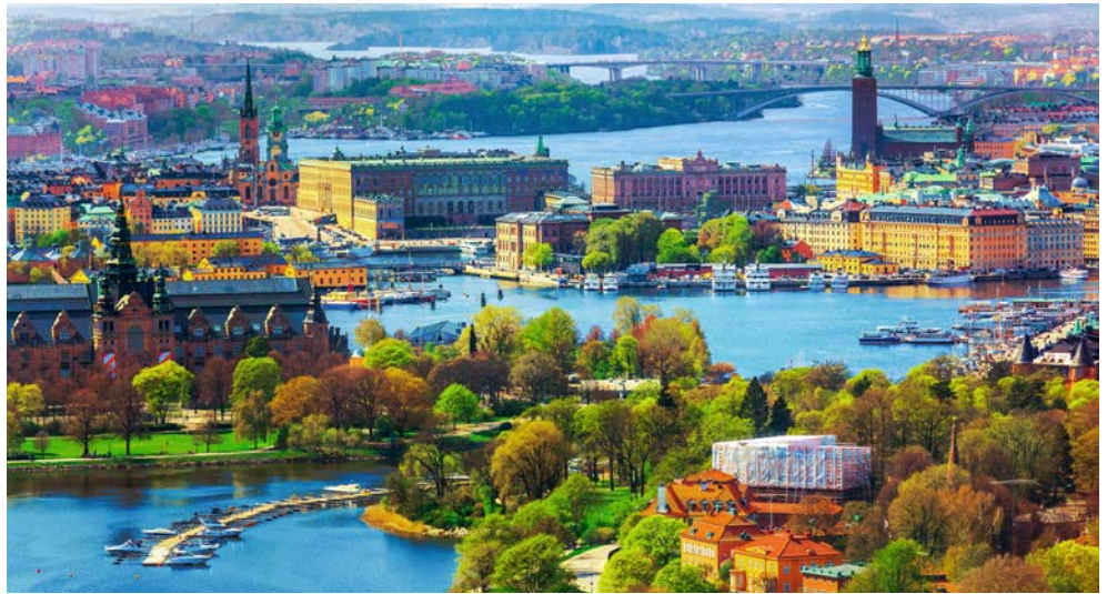
Erleben Sie Schwedens Hauptstadt Stockholm

Erleben Sie die faszinierende Vielfalt Schwedens auf einer unvergesslichen Rundreise: Von der eleganten Hauptstadt Stockholm über idyllische Orte wie Trosa, Linköping und Ystad bis hin zur Heimat Astrid Lindgrens in Vimmerby entdecken Sie die schönsten Seiten des Landes. Majestätische Schlösser, malerische Altstädte, atemberaubende Landschaften und kulturelle Höhepunkte erwarten Sie – Schweden in seiner ganzen Pracht!