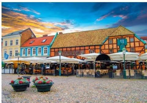
Entdecken Sie Malmö

Polizeipräsidium sehen. Danach besuchen Sie das Ystad Studios Visitor Center (Filmstudio) und erhalten einen Blick hinter die Kulissen der Wallander-Filme. Anschließend Weiterfahrt nach Lund, wo Sie eine Stadtführung erleben. Lund ist eine weltbekannte Universitätsstadt seit 1666 und hat eine sehr schöne Domkirche. Von hier ist es nicht mehr weit bis nach Malmö. Übernachtung im Quality Hotel the Mill o. ä. Ca. 250 km (F)