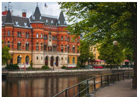
Die Altstadt von Örebro

Weiterfahrt in östlicher Richtung zurück nach Stockholm. Zunächst besichtigen Sie das Sommerschloss Drottningholm, Wohnsitz der schwedischen Könige. Im Anschluss an die Führung haben Sie Gelegenheit zu einem Spaziergang durch die das Schloss umgebende hübsche Parkanlage. Anschließend Stadtrundfahrt in Stockholm. Die wichtigsten Sehenswürdigkeiten sind u.a. die hübsche Altstadt „Gamla Stan“ mit dem Königlichen Schloss, der „Deutschen Kirche“ und dem Dom (Außenbesichtigung) sowie die Riddarholmen-Kirche (Außenbesichtigung). Transfer zum Hotel und Übernachtung im Scandic Wallin oder Elite Palace. Ca. 200 km (F)