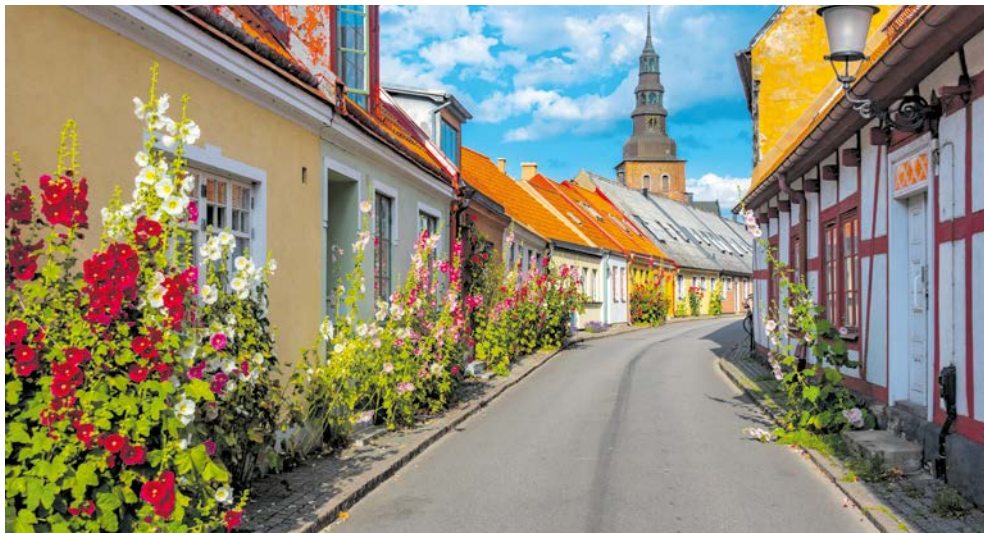
Das zauberhafte Ystad

Polizeipräsidium sehen. Danach besuchen Sie das Ystad Studios Visitor Center (Filmstudio) und erhalten einen Blick hinter die Kulissen der Wallander-Filme. Anschließend Weiterfahrt nach Lund, wo Sie eine Stadtführung erleben. Lund ist eine weltbekannte Universitätsstadt seit 1666 und hat eine sehr schöne Domkirche. Von hier ist es nicht mehr weit bis nach Malmö. Übernachtung im Quality Hotel the Mill o. ä. Ca. 250 km (F)