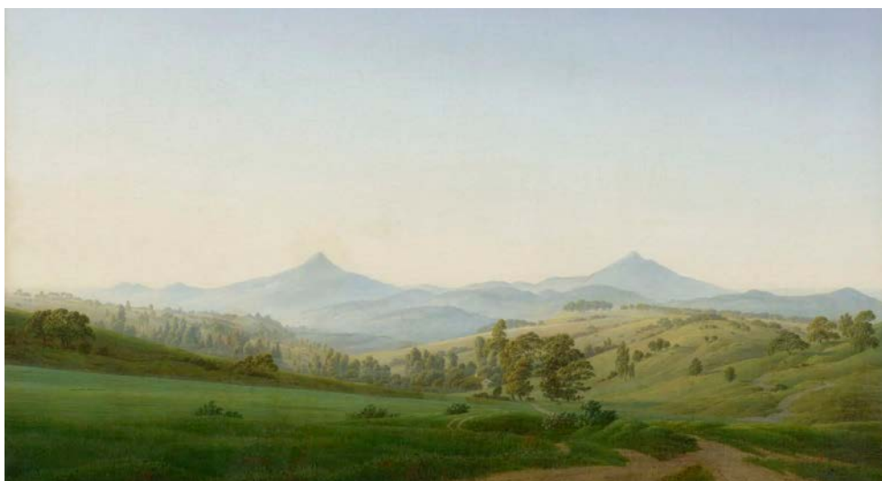
Caspar David Friedrich – Böhmische Landschaft mit dem Milleschauer