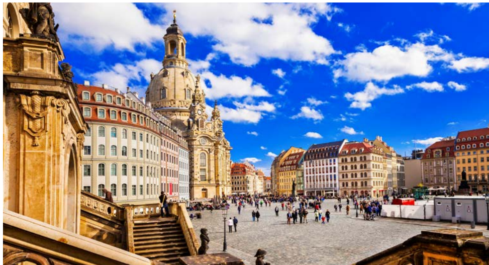
Frauenkirche am Neumarkt

Deutschland feiert in diesem Jahr Caspar David Friedrich und ehrt einen der größten deutschen Künstler mit einem vielfältigen Veranstaltungsreigen. Den Abschluss der zahlreichen Sonderveranstaltungen bildet eine große Sonderausstellung im Albertinum Dresden. Unter dem Titel »Caspar David Friedrich. Wo alles begann« zeigt das Albertinum Dresden zahlreiche Werke des größten Romantiker aller Zeiten. Nach großen Sonderausstellungen in Hamburg, Greifswald und Berlin, sicherlich ein gebührender Abschluss der Feierlichkeiten zum 250. Geburtstag. Darüber hinaus hat Dresden viel zu bieten: Frauenkirche und Alte Meister, Grünes Gewölbe und Semperoper, barocke Altstadt und moderne City – die sächsische Landeshauptstadt begeistert als Gesamtkunstwerk und empfängt ihre Besucher mit einer Fülle an bekannten Sehenswürdigkeiten. Entdecken Sie den außergewöhnlichen Charme der auch als Elbflorenz bezeichneten Stadt! Perfekter Ausgangspunkt ist das Steigenberger Hotel de Saxe im Herzen der Dresdener Altstadt. Von hier aus lassen sich nahezu alle Sehenswürdigkeiten entspannt zu Fuß erreichen. Freuen Sie sich außerdem auf die Semperoper, welche als eines der schönsten Theaterhäuser der Welt gilt. Sie ist die Heimat der Sächsischen Staatskapelle Dresden, einem der traditionsreichen Orchester der Welt, welche seit Jahrzehnten Opern-Geschichte schreibt.