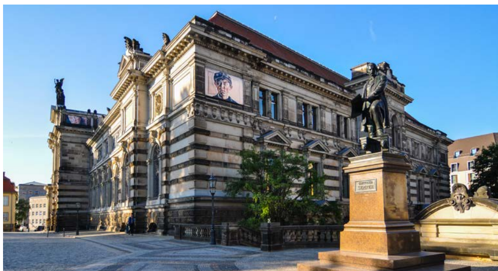
Genießen Sie die Sonderausstellung »Caspar David Friedrich. Wo alles begann« im Albertinum