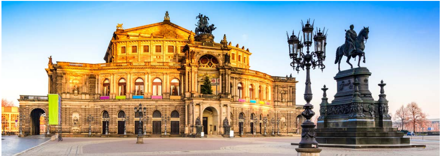
Ein Ohren- und Augenschmaus – die Vorstellung „La Traviata“ in der Semperoper