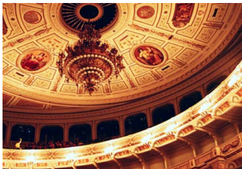
Freuen Sie sich auf die Semperoper

Hat Schmerz jemals schöner geklungen als in Verdis „La traviata?“