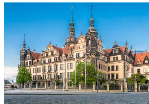
Machen Sie eine Zeitreise im Grünen Gewölbe

Im Laufe des Tages erfolgt Ihre Bahnreise in der 1. Klasse von Ihrem Heimatbahnhof nach Dresden. Dort angekommen erreichen Sie Ihr Hotel nach einer kurzen Taxi-Fahrt (nicht inklusive) in nur wenigen Minuten. Nachdem Sie sich in Ihrem Zimmer eingerichtet haben, begrüßt Sie Ihre Reiseleitung um ca. 18 Uhr im Hotel. Als Einstimmung auf die vor uns liegenden Tage erwartet Sie dann ein Dreigänge-Menü im hervorragenden Restaurant des Hotels (Getränke nicht inklusive). Vielleicht lassen Sie den ersten Abend dann an der Hotelbar gemütlich ausklingen.