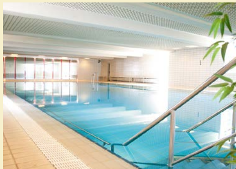
Tun Sie sich etwas Gutes