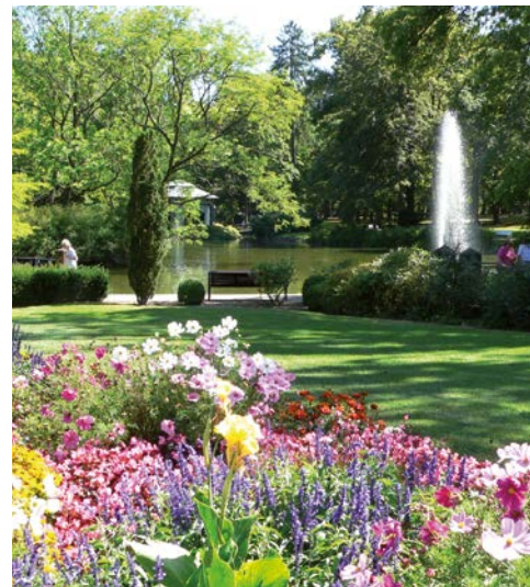
Unbedingt einen Spaziergang wert – der Kurpark

Majestätisch thront das Schloss Friedrichstein über der Stadt Bad Wildungen und ist auch schon von Weitem gut zu erkennen. Heute befindet sich hier ein Teil der Museumslandschaft Hessen-Kassel mit Sammlungen aus der hessischen Militär- und Jagdgeschichte. Kaffee und Kuchen können Sie im Schlosscafé genießen, welches in den Sommermonaten die Türen zur Terrasse des Südflügels öffnet und einen schönen Blick auf Bad Wildungen und die Umgebung frei gibt.