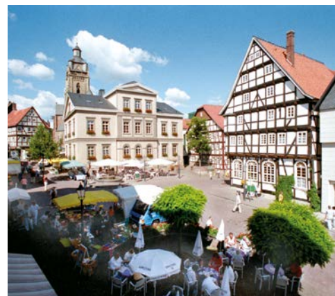
Marktplatz in Bad Wildungen