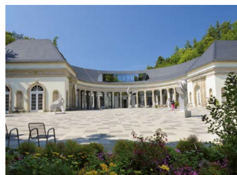
Die Wandelhalle im Kurpark