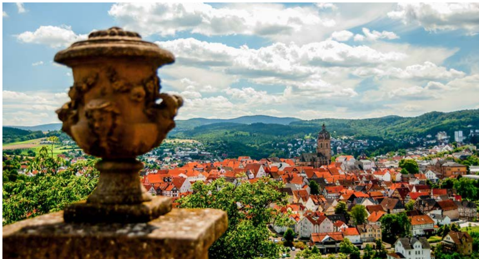
Blick auf Bad Wildungen von Schloss Friedrichstein...