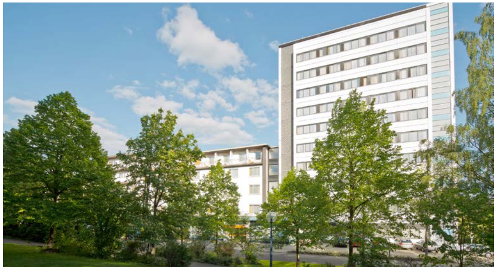
Ihre Anlaufstelle für Gesundheit und Entspannung – das Gesundheitszentrum Helenenquelle

Mit dem CUP VITAL Service-Taxi reisen Sie ganz bequem von Zuhause ins Gesundheitszentrum Helenenquelle und zurück – inklusive Kofferservice – sicher und schnell!