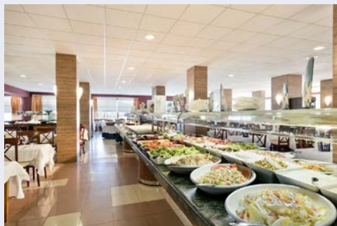
Freuen Sie sich auf ein leckeres Frühstück