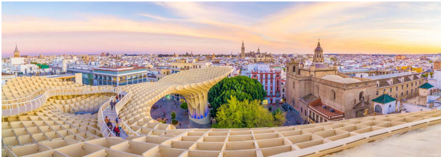
Blick auf Sevilla