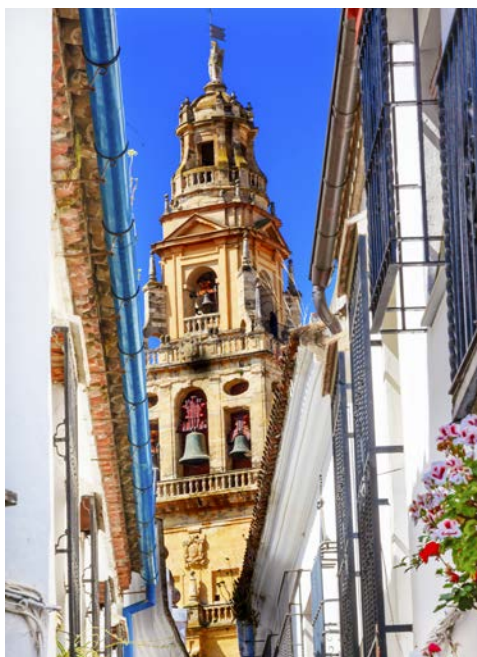
Imposante Mezquita in Córdoba

Frühstück im Hotel. Im Anschluss lernen Sie mit Mijas ein typisches andalusisches Bergdorf kennen. Hier können Sie einen herrlichen Blick auf die Küste der Costa del Sol genießen und durch verwinkelte Gassen mit weiß getünchten Häusern bummeln. Der restliche Tag steht zur freien Verfügung. Abendessen und Übernachtung im Hotel.