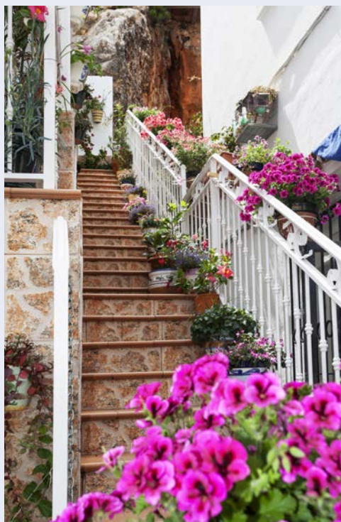
Beeindruckend – Ronda

Frühstück im Hotel. Entspannen Sie sich am Strand oder unternehmen etwas auf eigene Faust. Abendessen und Übernachtung im Hotel.