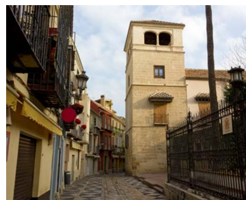
Málaga mit Picasso Museum

Frühstück im Hotel. Heute geht die Fahrt nach Granada, der berühmten maurischen Residenzstadt am Fuße der Sierra Nevada. Sie besichtigen die weltberühmte Alhambra mit ihren wunderschönen Gartenanlagen und der beeindruckenden maurischen