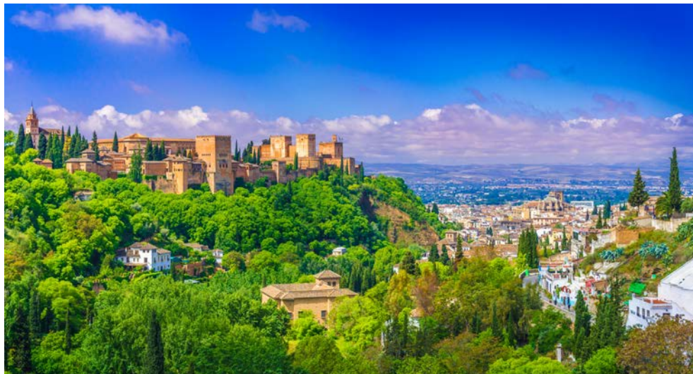
Die Alhambra in Granada von außen

„Al-Andalus“ nannten die Mauren das im Jahre 711 von ihnen eroberte Südspanien. Es wird auch mit ‚Land des Lichts‘ übersetzt, weil Licht auf Spanisch ‚luz‘ heißt. Künstler und Dichter haben dieses intensive andalusische Licht besungen. Die Mauren brachten das trockene Andalusien mit ihren ausgetüftelten Bewässerungsanlagen zum Blühen. Auf sie geht der Brauch zurück, die ‚Patios‘, Innenhöfe, mit bemalten Kacheln auszukleiden, so dass diese selbst bei brennender Hitze kühl bleiben. Sie schufen Bauwerke wie die Mezquita in Córdoba und die Alhambra, ‚Die Rote Burg‘, in Granada, dessen ornamentale Ästhetik, klingende Wasserspiele und filigrane Lichtkuppeln es zum schönsten maurischen Bauwerk der Welt machen. Auch die andalusische Mentalität scheint von maurischen Einflüssen geprägt. Sie ist voller sinnlicher Lebensfreude, Spaß an Geselligkeit, genießerischer Freude an delikaten Tapas und einer Gemütsruhe und Gelassenheit, die sich am besten in dem Satz ‚Venga usted mañana‘, – ‚Kommen Sie morgen noch einmal‘ – widerspiegelt.