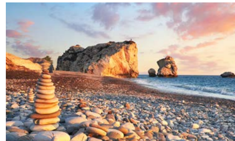
Strand der Aphrodite

Weitere buchungsrelevante Informationen zu dieser Reise (An- und Abreise, Gesundheitshinweise, Barrierefreiheit, eventuell anfallende Mehrkosten während der Reise etc.) erhalten Sie im Internet unter: www.hanseatreisen.de