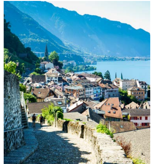
Montreux abseits der mondänen Uferpromenade