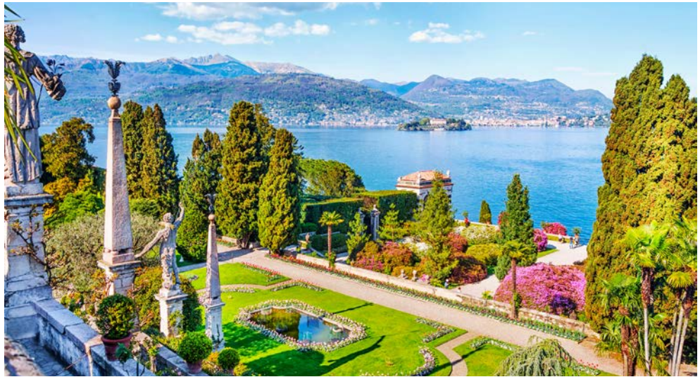
Die Isola Bella, „die schöne Insel“ im Lago Maggiore

Ziel des heutigen Tages ist die malerische Provinz Novara im östlichen Teil des Piemont. Die Region ist eingebettet in die Reisanbaugebiete der Flüsse Sesia und Ticino. Umgeben von Weinbergen und Schlös- sern liegt die gleichnamige und geschichtsträchtige Provinzhauptstadt Novara mit ihren historischen Gebäuden, Türmen und dem Wahrzeichen, der Basilica di San Gaudenzio. Nach einer interessanten Stadtführung in Novara erreichen Sie die kleine Ortschaft Sillavengo. Dort werden Sie in einem historischen Herrenhaus aus dem 17. Jahrhundert zu einem typisch piemontesischen Mittagessen begrüßt. Lassen Sie sich kulinarisch verwöhnen, ehe die Rückfahrt zurück an den Lago Maggiore erfolgt.