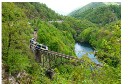
„Centovalli“ bedeutet hundert Täler