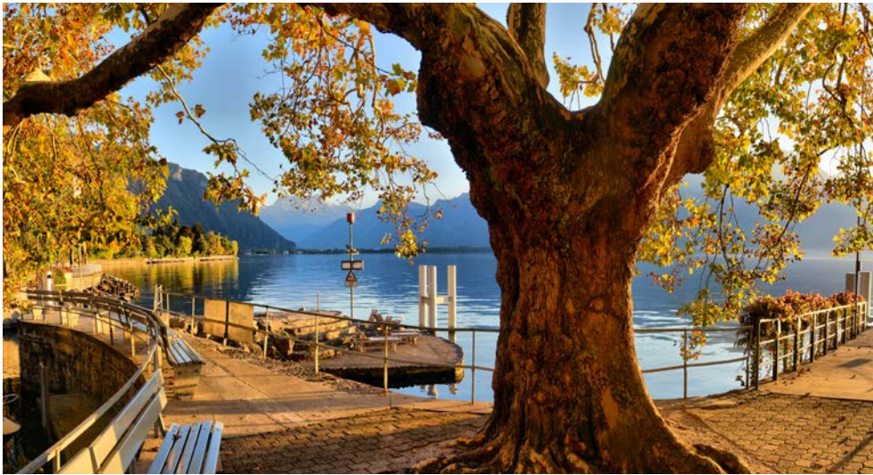
Willkommen in Montreux