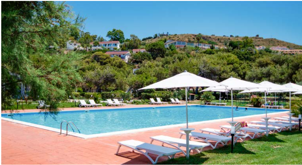
Hotel-Pool (links) und die herrliche Sicht aufs Meer (rechts)