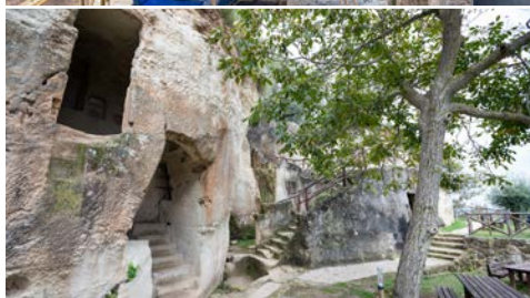
Scilla (oben), Höhlen von Zungri (unten)