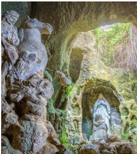
Pizzo, Höhlenkirche Piedigrotta

Die Wanderetappe beginnt in Alt-Comerconi, dem „Dorf des Weines, des Olivenöls und des schwarzen Trüffels“. Sie werden einen schönen, naturbelassenen Weg einschlagen, der Ihnen spektakuläre Ausblicke über die Region ermöglicht. Unterwegs besuchen Sie eine kleine Bäckerei. In diesem Familienbetrieb sehen Sie wie Brot und heimisches Süßgebäck produziert werden. Während der weiteren Wanderoute durch die Hochebene des Monte Poro sehen