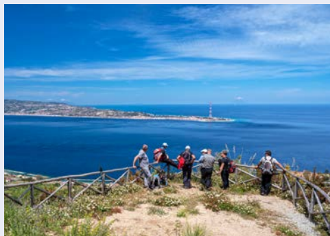
Blick auf die Straße von Messina

Kalabrien liegt an der Spitze des Stiefels am südlichsten Punkt Italiens. Das angenehme Klima, die wunderschönen Farben des Meerwassers, die von Sandstränden unterbrochenen felsigen Küsten, die wilde, geheimnisvolle Landschaft, der deftige und unverfälschte Geschmack der heimischen Küche und die Zeugnisse der antiken Vergangenheit machen Kalabrien zu einem einzigartigen Landstrich, fernab vom Massentourismus. Hier geht jeder Reisewunsch in Erfüllung! Besonders intensiv erleben Sie die zauberhafte Region und ihre gastfreundlichen Einheimischen bei den geführten Wanderungen. Alternativ genießen Sie Ihr zauberhaftes Strandhotel und unternehmen tagsüber Panoramafahrten mit geführten Besuchen im Rahmen des Ausflugspaketes. Hier lernen Sie z.B. Zungri mit landestypischer Verkostung kennen.