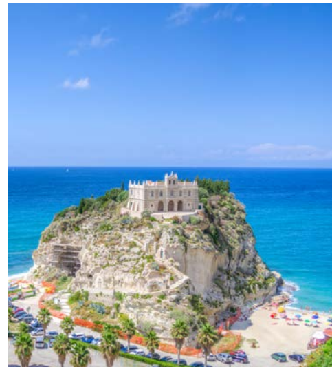
Tropea, Kirche Santa Maria dell'Isola

Mit dem Bus geht es Richtung Scilla/Reggio Calabria. Ihre Wanderung auf dem Tracciolino Pfad führt entlang der faszinierenden Küstenlandschaft der „Costa Viola“. Diese Küste bietet eine reiche mediterrane Vegetation und traumhafte Panoramablicke auf Capo Vaticano, das Fischerdorf Scilla und die Straße von Messina. Bei gutem Wetter reicht der Blick bis auf den Ätna auf Sizilien oder die Äolischen Inseln. Durch einen Pinienwald geht es bis zum Monte Sant'Elia (580 m), der aufgrund seiner Lage auch „Balkon am Tyrrhenischen Meer“ genannt wird. Am Fuße