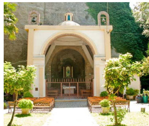
Grotte der Madonna delle Fonti in Spilinga

Nach dem Frühstück Transfer zum Flughafen und Rückreise. (F)