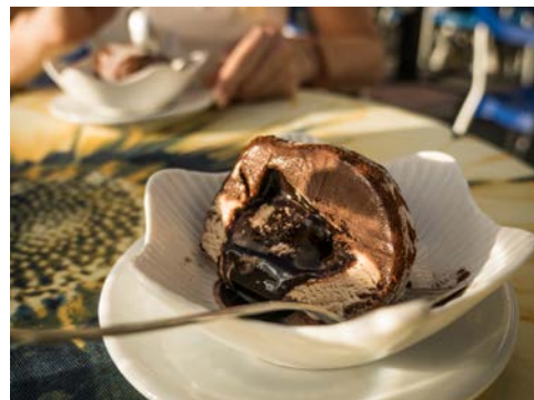
Kosten Sie ein echtes Tartufo in Pizzo!