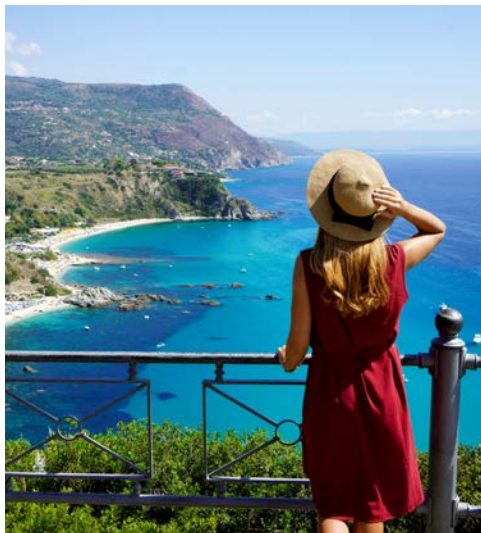
Fantastische Aussichten vom Capo Vaticano