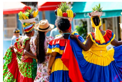
Palenqueras Frauen in Cartagena

Restaurants und die farbenfrohen Wandmalereien. Das komplett vom Festungsring ummauerte alte Stadtzentrum sowie die Kathedrale und das Viertel der kleinen Händler, San Diego, gehören seit 1984 zum UNESCO-Weltkulturerbe.