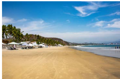
Strand bei Manzanillo

Die Hafenstadt Manzanillo liegt an und oberhalb einer geschützten Bucht am pazifischen Ozean und bietet einen der größten Häfen Mexikos. Strand und Fisch ist hier das Motto – u.a. ist das Aufkommen des Fächerfisches hier besonders hoch. Die Strände sind weitläufig und laden zum Schwimmen, Schlendern und zu sportlichen Aktivitäten ein. Natur und Stadterlebnis vereinen sich in schöner Art und Weise.