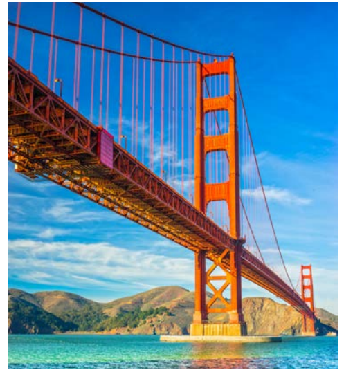
Die Golden Gate Bridge in San Francisco