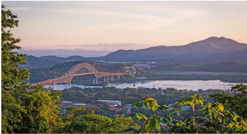
Freuen Sie sich auf den Panamakanal