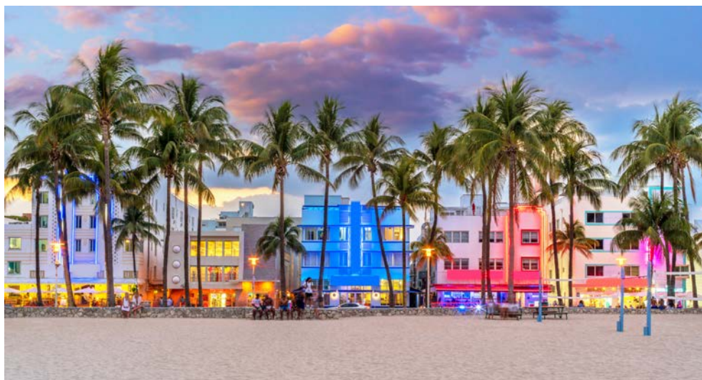
Vielleicht besuchen Sie Miami South Beach?