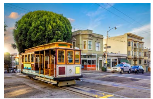
Cable Car in San Francisco