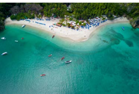
Tortuga Island in Puntarenas

Puerto Quetzal sollte heute Ihr Ausgangspunkt für einen Ausflug nach Antigua sein. Die UNESCO bewertet Antigua als ein herausragendes Beispiel bewahrter Kolonial-Architektur. Kirchliche, private und öffentliche Gebäude verkörpern noch heute den spanischen Baustil der kolonialen Epoche.