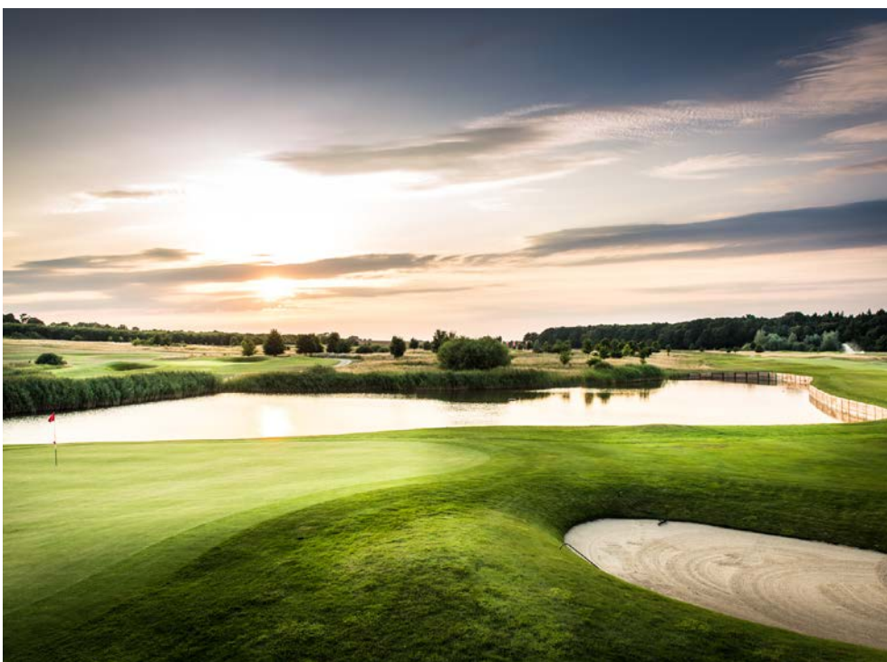
„Schönes Spiel!“ auf einem der schönsten Plätze Deutschlands

Sie möchten früher anreisen oder Ihren Aufenthalt verlängern. Gern buchen wir Ihnen Ihren Wunschtermin. Weitere Zimmerkategorien und Änderungen Ihres Aufenthaltes auf Anfrage und nach Verfügbarkeit möglich.