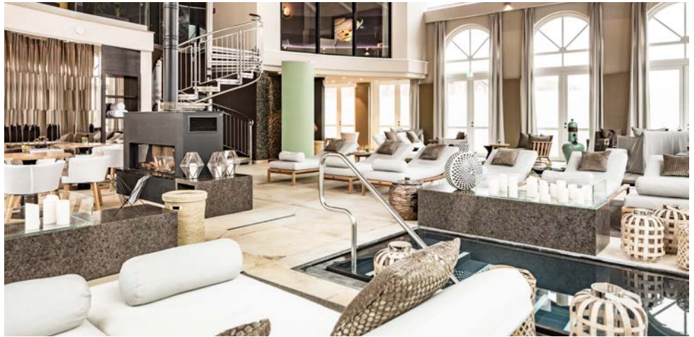
Relaxen Sie im SCHLOSS Spa