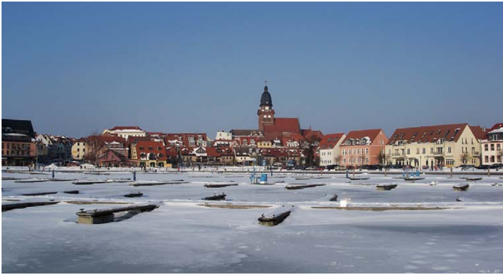
Je nach aktueller Wetterlage sieht es in Waren an der Mützig vielleicht so aus ...