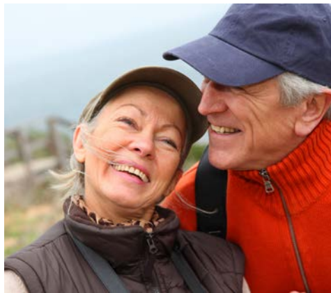
Gönnen Sie sich eine Auszeit

In der Altstadt wandeln Sie überall auf historischen Spuren, und Sie können die liebevoll restaurierten Fachwerkhäuser bestaunen. Sehen Sie auch die beiden Kirchen St. Marien und St. Georgen sowie das Alte und das Neue Rathaus am Neuen Markt. Besonders interessant sind das Mützigmuseum, ein einzigartiges Naturerlebniszentrum, sowie der Stadthafen mit seinem sehenswerten maritimen Ensemble.