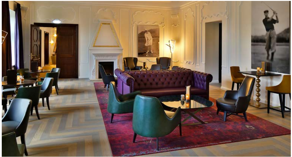
Entspannen Sie im stilvollen Ambiente

Der Valentinstag ist ein optimaler Anlass Zeit zu Zweit oder mit der Familie zu verbringen.