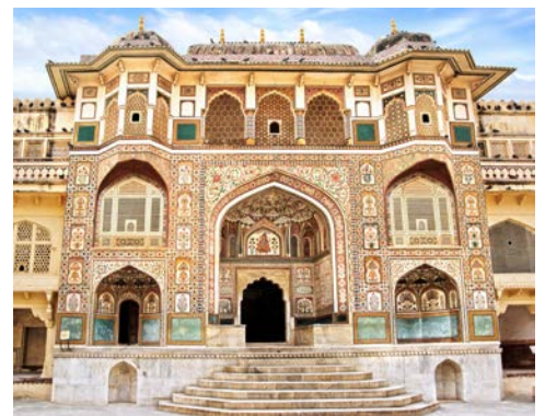
Palast von Amber