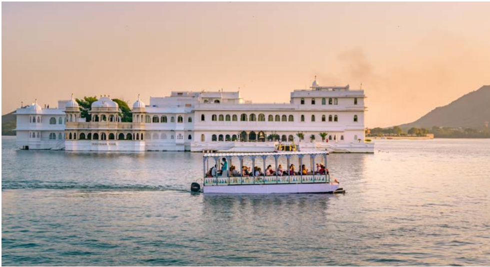
Genießen Sie eine Bootsfahrt auf dem Pichola-See