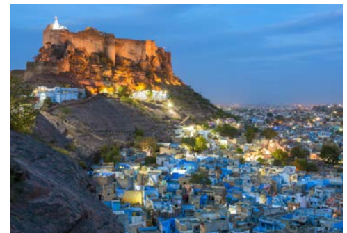
Die „Blaue Stadt“ und Fort Mehrangarh

Die Tagesetappe führt nach Jodhpur am Rande der Wüste Tharr im Nordwesten Rajasthans. Die Verwendung von überwiegend blauer Wand- und Fassadenfarbe hat der Stadt den Beinamen „Blaue Stadt“ eingetragen. Über der ausgedehnten Altstadt thront auf einem hohen Felsen das mächtige Fort Mehrangarh. Danach besuchen Sie Jaswant Thada, einer dem Maharadscha Jaswant Singh II gewidmeten Gedenkstätte. Übernachtung in Jodhpur.