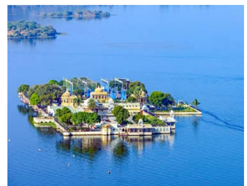
Seenlandschaft in Udaipur

Auf der Weiterfahrt nach Udaipur besuchen Sie in einem Tal des Aravilli-Gebirges Ranakpur, einen der schönsten Tempelkomplexe Indiens. Der Haupttempel wurde 1449 erbaut. 1.444 Säulen bilden den Rahmen für 29 hallenartige Räume. Dann erreichen Sie Udaipur, die „Stadt der Paläste“, in einer für diesen Teil des Landes ungewöhnlichen Seenlandschaft vor einer schönen Bergkulisse gelegen. Übernachtung in Udaipur.