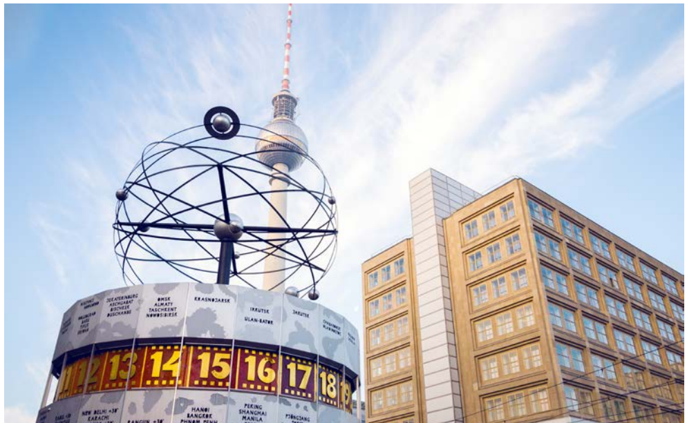
Weltzeituhr auf dem Alexanderplatz

Es ist die erste Adresse der Hauptstadt: das legendäre Luxushotel Adlon Kempinski Berlin. Internationale Staatsgäste und Stars geben sich hier regelmäßig die Klinke in die Hand. Schräg gegenüber von Berlins weltbekanntem Wahrzeichen, dem Brandenburger Tor, gelegen, genießt das renommierte Gästehaus Weltruf. „Adlon oblige“ – Adlon verpflichtet, lautet das Credo des Eleganz und Genuss vereinenden Hauses mit seinen äußerst komfortabel ausgestatteten Zimmern. Damit knüpft das 1997 wiedereröffnete Hotel an die Tradition des historischen Adlon an und steht dadurch gleichermaßen für das alte und das neue Berlin, jene verschiedenen Seiten der Hauptstadt, die Sie auf mehreren Touren entdecken. Sie sehen unter anderem den Gendarmenmarkt, das Regierungsviertel, den Kurfürstendamm und den Reichstag. Ein weiterer Höhepunkt ist ein Ausflug in die berühmte Schlösser- und Parklandschaft von Sanssouci in Potsdam.