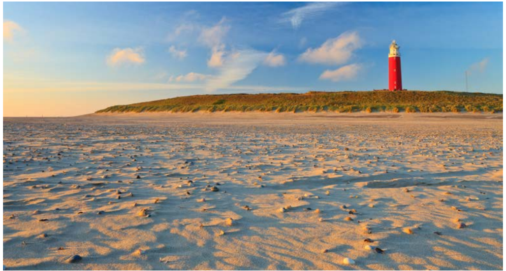
Idyllische Landschaft auf Texel

Einige Stops dienen der Ausflugsabwicklung