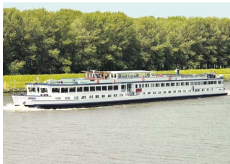
Willkommen auf der SERENA