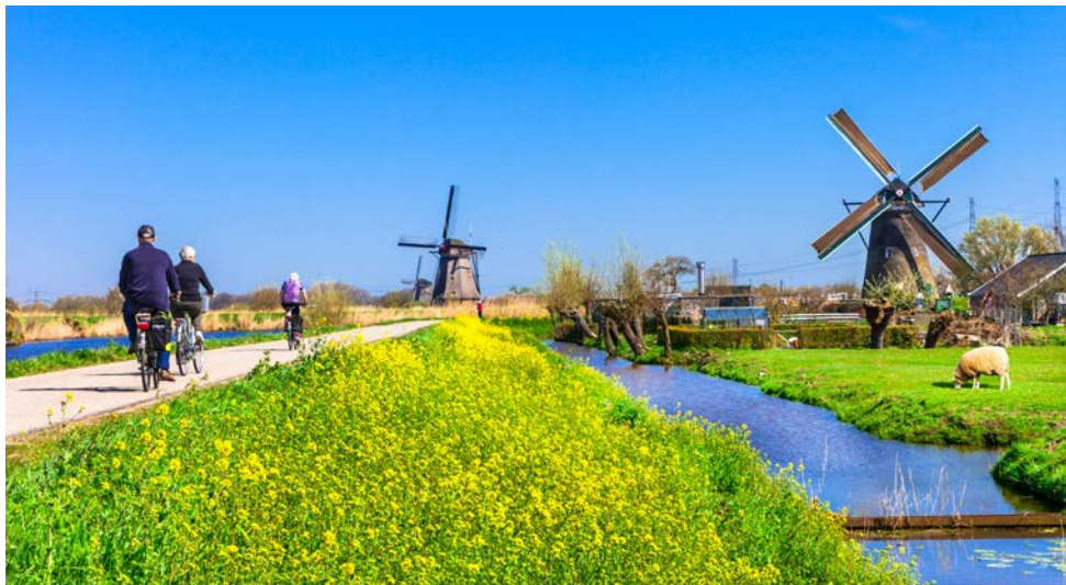
Windmühlen sehen Sie auf Ihren Touren nahezu überall