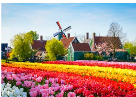
Zaanse Schans – Ein Besuch ist lohnenswert

Routen von ca. 29 bis 70 km stehen zur Wahl. Gegen Abend geht es per Schiff weiter nach Den Helder.