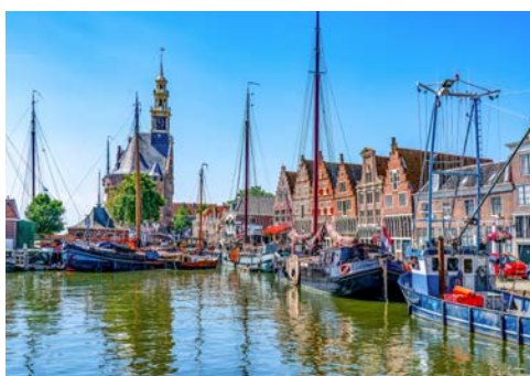
Alter Hafen von Hoorn