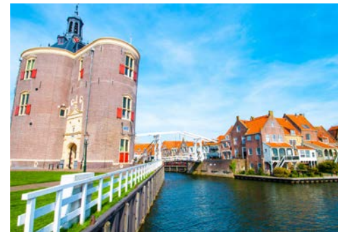
Altes Stadttor in Enkhuizen