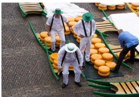
Auf dem Käsemarkt in Alkmaar

Von Wormerveer starten Sie morgens zum Freilichtmuseum Zaanse Schans, vorbei an Windmühlen und altholländischen Dörfern. Bevor es weiter zum traditionsreichen Fischerdorf Volendam mit typischen authentischen Häuschen geht, haben Sie die Möglichkeit, in Katwoude eine Käserei zu besuchen,