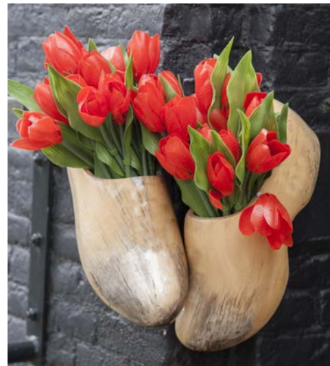
Traditionelle holländische Holzschuhe