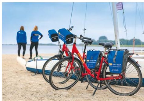
Unterwegs mit dem Mietfahrrad

Tipp: Ganz besonders zu empfehlen ist ein Besuch des Zuiderzeemuseums.