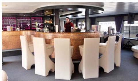
Willkommen an Bord!

Die 2-Bett-Kabinen auf beiden Decks haben 2 Einzelbetten, sind ca. 8-9 m 2 groß, die beiden Juniorsuiten auf dem Hauptdeck haben ein französisches Bett (Grandlit, 1,40 x 2,00 m) und sind ca. 12 m 2 groß. Die insgesamt drei Einzelkabinen (zwei Einzelkabinen auf dem Hauptdeck und eine Einzelkabine auf dem Promenadendeck) verfügen jeweils über ca. 6 m 2 (Preis auf Anfrage). Alle Kabinen verfügen über Dusche/WC, Belüftungssystem und ein zu öffnendes Fenster.