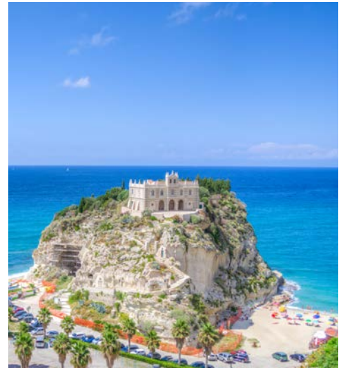
Tropea, Kirche Santa Maria dell'Isola

Mit dem Bus geht es Richtung Scilla/Reggio Calabria. Ihre Wanderung auf dem Tracciolino Pfad führt entlang der faszinierenden Küstenlandschaft der „Costa Viola“. Diese Küste bietet eine reiche mediterrane Vegetation und traumhafte Panoramablicke auf Capo Vaticano, das Fischerdorf Scilla und die Straße von Messina. Bei gutem Wetter reicht der Blick bis auf den Ätna auf Sizilien oder die Äolischen Inseln. Durch einen Pinienwald geht es bis zum Monte Sant'Elia (580 m), der aufgrund seiner Lage auch „Balkon am Tyrrhenischen Meer“ genannt wird. Am Fuße