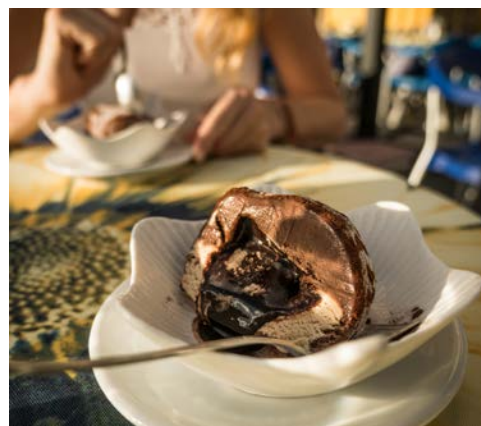
Kosten Sie ein echtes Tartufo in Pizzo!