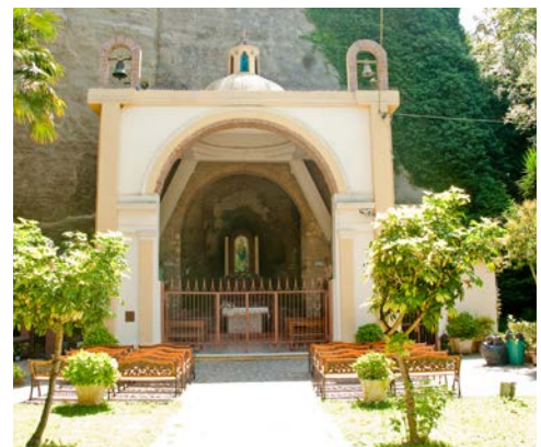
Grotte der Madonna delle Fonti in Spilinga

Nach dem Frühstück Transfer zum Flughafen und Rückreise. (F)