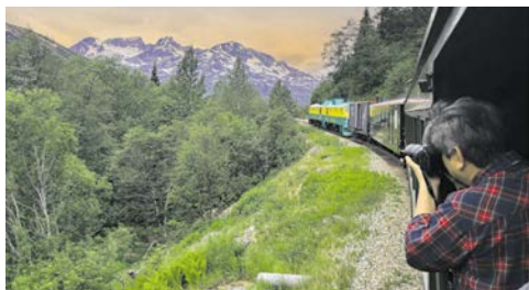
Einmalige Panoramen, spannende Tierwelt ...