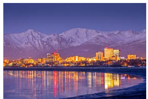
Skyline von Anchorage

Eine erlebnisreiche Reise geht zu Ende – am Morgen erfolgt der Transfer zum Flughafen und Rückflug nach Deutschland. Ankunft in Deutschland an Tag 14.