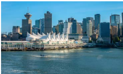
Vancouver – hier wird Ihr Schiff liegen!

Ihr Schiff hat bereits gleich neben Ihrem Hotel festgemacht und nach dem Frühstück im Hotel wird auf Wunsch Ihr Gepäck direkt vom Hotelzimmer in Ihre Kabine auf der KONINGS DAM gebracht. Das Kreuzfahrtterminal und die Einschiffung erfolgt im Tiefgeschoss Ihres Hotels, praktischer geht es nicht! Am Nachmittag heißt es dann Leinen los! Halten Sie Ausschau nach dem „We love Alaska“-Symbol am Bug Ihres Schiffes – mit der KONINGS DAM erwartet Sie ein exklusives Alaska-Erlebnis.