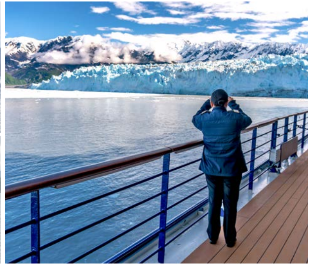
Mannigfache Impressionen erwarten Sie! Beindruckende Gletscher und Aussichten in der Inside Passage