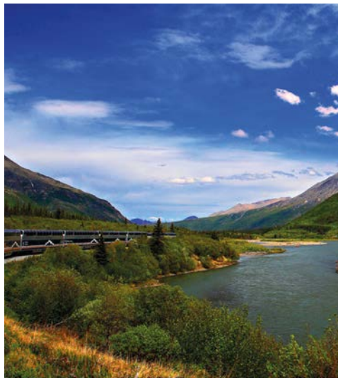
mit dem McKinley Explorer durch Traumlandschaften