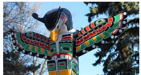
und unendlich viel mehr!

Tierwelt zu beobachten. Am Nachmittag erreichen Sie Whitehorse, die Hauptstadt des Yukon-Territoriums in Kanada. Nur wenige Städte auf der Welt bieten einen so umfassenden Zugang zu unberührter Wildnis und dennoch alle Annehmlichkeiten einer modernen Stadt. Bummeln Sie entlang des Yukon-Rivers und genießen Sie den Blick auf die umliegenden Berge.