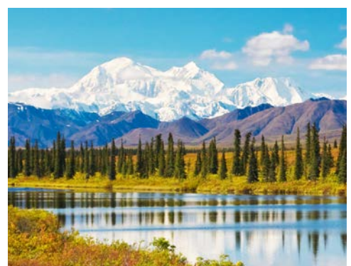
Blick auf den Mount McKinley, auch „der Denali“ genannt

Freuen Sie sich heute auf rund 370 Kilometer „Aussicht pur“! Die Fahrt vom Denali-Nationalpark nach Anchorage legt der McKinley Explorer in knapp 8 Std. zurück. Während der Fahrt können Sie dank der gläsernen Kuppel stets die atemberaubende Landschaft im Auge behalten. Gerne zieht es die Zugreisenden