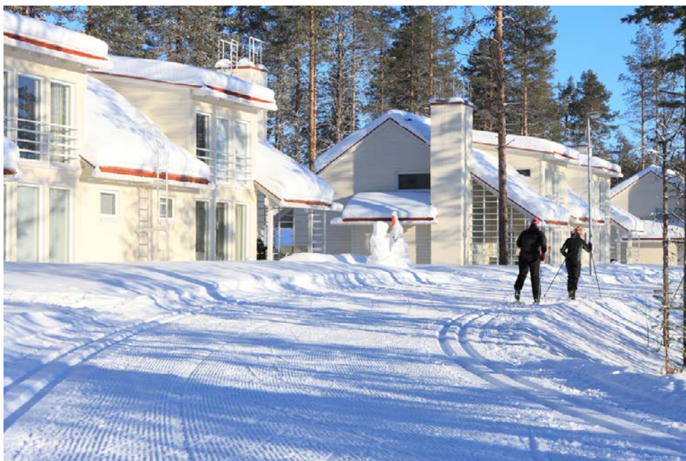
Vielleicht haben Sie Lust auf eine Runde Langlaufski auf der Loipenstrecke rund um das Hotel

So schön es im hohen Norden ist, heute ruft Sie die Heimat zurück. Nach dem Frühstück heißt es Abschied von Finnland nehmen. Transfer zum Flughafen und Rückreise.