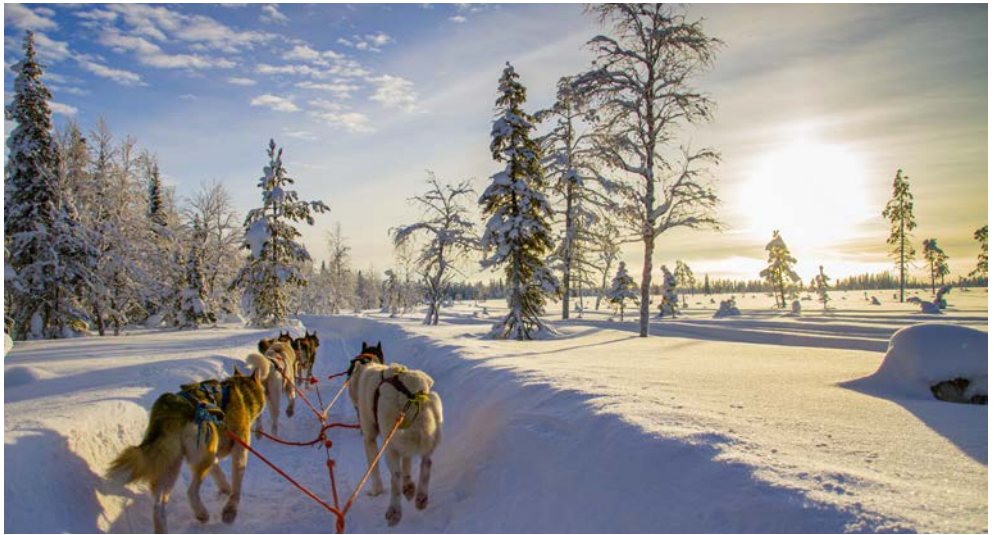
Die Huskys können es kaum erwarten, mit Ihnen Geschwindigkeit aufzunehmen

Wer ein echtes Winterparadies entdecken möchte, kommt an dieser fantastischen Reise einfach nicht vorbei! Magisch schimmernde Schneelandschaften erwarten Sie im Winterwunderland Finnisch-Lapplands. Erleben Sie einen unvergesslichen Winterurlaub inmitten verschneiter Wälder, zugefrorener Seen und mit etwas Glück dem Zauber der geheimnisvollen, grünlich leuchtenden und tanzenden Polarlichter. Lernen Sie die Region und Traditionen bei einer Schneeschuhwanderung, Hundeschlittenfahrt und einer rasanten Fahrt mit dem Motorschlitten näher kennen und entspannen Sie im Anschluss in der typisch finnischen Sauna. Diese Reise wird zu einem unvergesslichen Erlebnis!