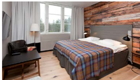
Zimmerbeispiel (ca. 18 m 2 )

Die 123 Zimmer und 55 Appartements bieten Ihnen den gewohnten Komfort eines guten Mittelklassehotels. Kostenfreies WLAN kann in allen Unterkunftseinheiten genutzt werden. Die renovierten und modern eingerichteten Doppelzimmer (ca. 18 m 2 ), klassisch eingerichtete große Doppelzimmer (ca. 28 m 2 mit ausklappbarem Schlafsofa) sowie Familienzimmer Superior (ca. 36 m 2 , zwei Doppelbetten und Doppelstockbett in zwei offen miteinander verbundenen Zimmern) sind im Haupthaus untergebracht und verfügen über Du/WC, TV und Haartrockner. Die geräumigen Appartements und Ferienhäuser liegen verstreut in der Anlage und bieten viel Platz für Familien und befreundete Paare. Neben 2 separaten Schlafzimmern, einem Wohnbereich mit Kamin und Sofaecke, einem Küchenbereich und einem verglasten Balkon bietet Ihnen die private Sauna im Bad Entspannung pur.