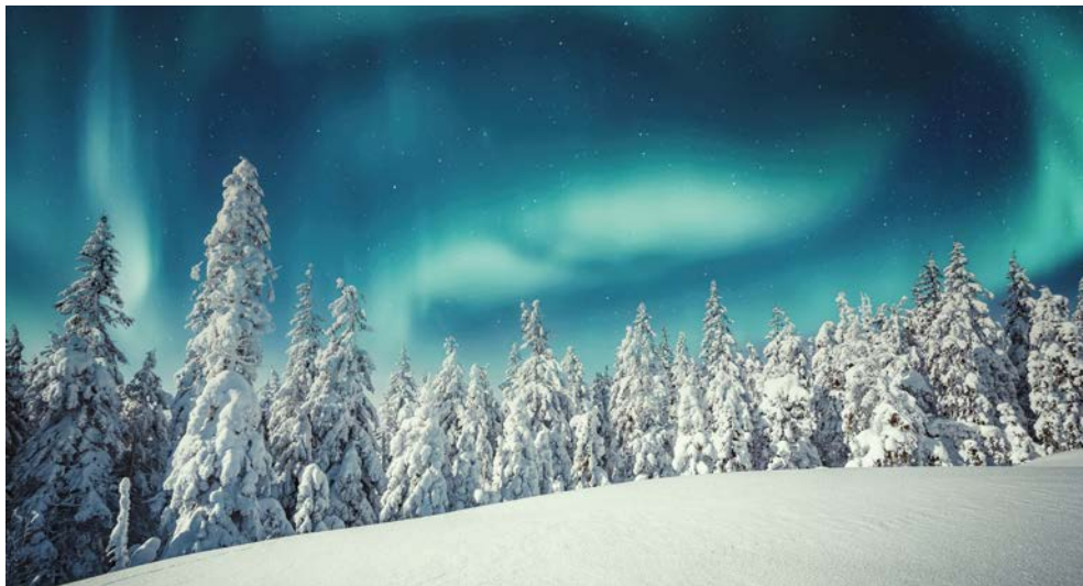
Was für ein Naturspektakel!