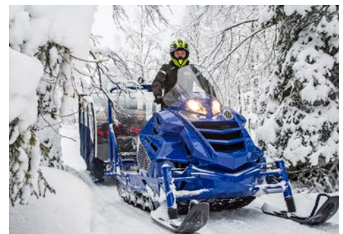
Abenteuer pur bei einer Motorschlittensafari

Am Vormittag führt Sie ein Ausflug auf eine Rentierfarm und zur dort lebenden Familie. Hier erfahren Sie aus erster Hand Näheres über die Bedeutung der Tiere für die Menschen in der Region. Selbstverständlich haben Sie die Gelegenheit die Tiere zu füttern. Eine kleine Rentierschlittenfahrt wird dabei natürlich nicht fehlen. Beim späteren Abstecher in die wohl typischste Institution der Finnen können Sie die vielen Eindrücke der Reise Revue passieren lassen – ein Erlebnis der besonderen Art wartet beim Besuch einer Blockbohlensauna auf Sie. Ganz Mutige können sich nach dem Saunagang beim Bad im zugefrorenen See erfrischen (körperliche Eignung vorausgesetzt).