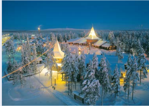
Das Weihnachtsmanndorf in Rovaniemi