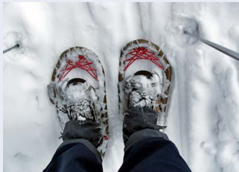
Unterwegs mit Schneeschuhen