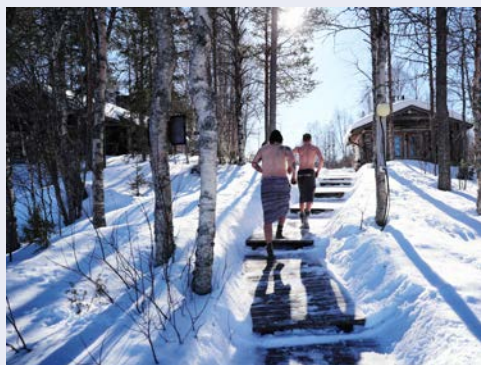
Wie wäre es mit einem Eisbad nach dem Saunabesuch?