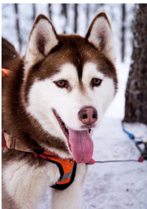
Nicht nur niedlich, sondern hierzulande ein starker Partner