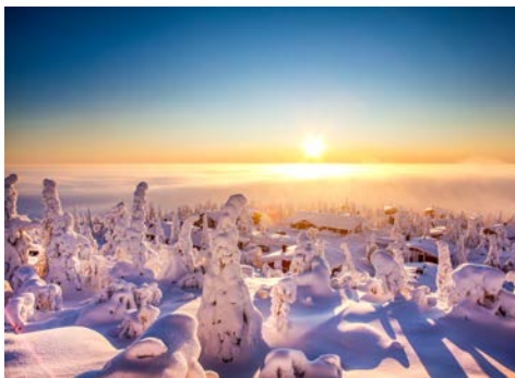
Willkommen in Lappland